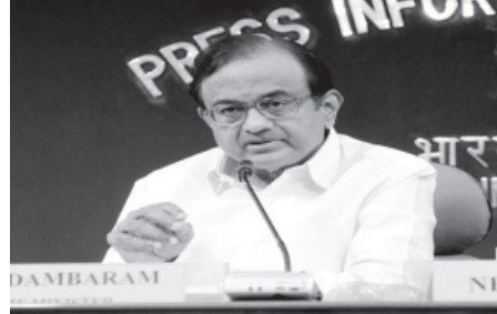
આનાથી ઘણા મોટા કોર્પોરેટ ગુહો બેંકિંગ ક્ષેત્રમાં એન્ટ્રી કરી શકે છે. નવા બેંકિંગ લાઈસન્સ માટે અરજી

આરબીઆઈએ નવી બેંકમાં વિદેશી હિસ્સેદારી પર ૪૯ ટકાની મર્યાદા નક્કી કરી છે સાથે સાથે લઘુત્તમ પેઈડ અપ ઈક્વિટી મૂકી ૫૦૦ કરોડની રહેશે.