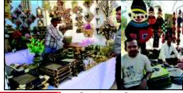
(તસવીર : નિકેસ બારોટ)