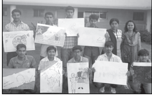
માહિતીસભર ચિત્રો દોર્યા હતા તેમજ સ્વચ્છતાના ગુણો જીવનમાં અપનાવવાના શપથ લીધા હતા.

ગાંધીનગર, તા. ૩૧ ગાંધીનગર શહેર અને જિલ્લામાં તા. ૩૦મી જાન્યુઆરી ગાંધી નિર્વાણ દિને વડાપ્રધાન નરેન્દ્ર મોદીના આહવાનથી મહાત્મા ગાંધી સ્વચ્છતા અભિયાન અંતર્ગત દરેક શાળાઓમાં ચિત્ર સ્પર્ધાનું આયોજન કરવામાં આવ્યું હતું. આ સ્પર્ધામાં વિદ્યાર્થીઓએ ઉત્સાહપૂર્વક ભાગ લીધો હતો અને અનેક