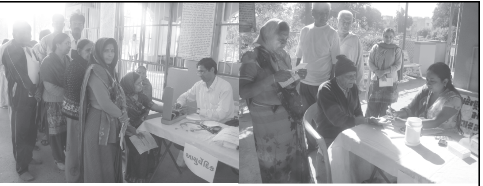
યુનાઈટેડ ચેરીટેબલ ટ્રસ્ટ અને શ્રી ત્ર્યંબકચંદ્ર મહાદેવ મંદિર સેક્ટર-૮ દ્વારા નિ:શુલ્ક બોડી ચેક અપ કેમ્પનું આયોજન રવિવારના રોજ ૯ થી ૧૨ દરમિયાન સેક્ટર-૮ ત્ર્યંબકચંદ્ર મહાદેવ મંદિર ખાતે કરવામાં આવ્યું હતું. જેમાં ૩૯૨૨૬, ઓર્થોપીડીક આયુર્વેદિક નિષ્ણાંત ડોક્ટરોની રાહબરી હેઠળ ૧૫૩ જેટલા સેક્ટરવાસીઓએ આ કેમ્પનો લાભ લીધો હતો.