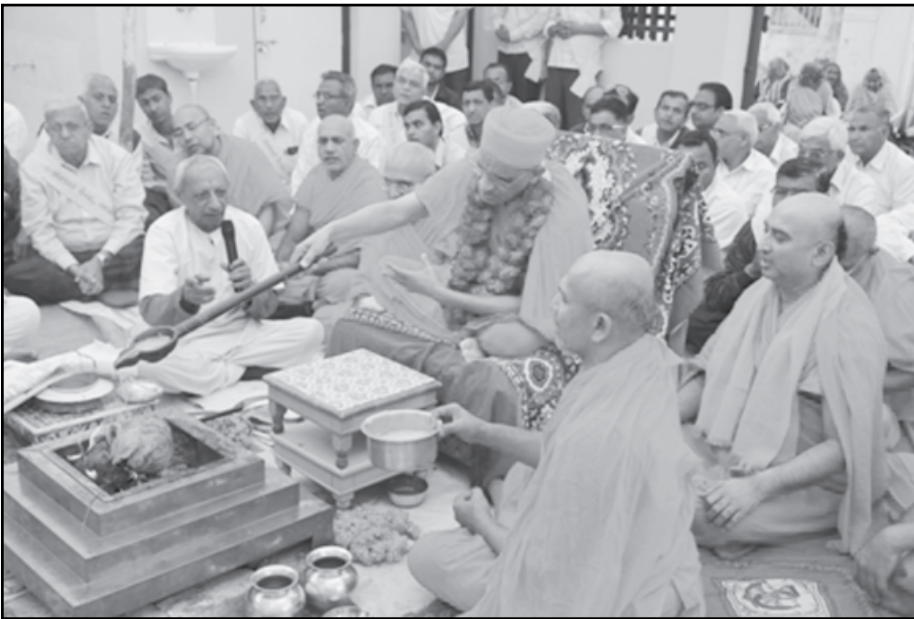
વણરાથી ઘેરાયેલો હોય છે જેથી તેના જીવનમાં સત્સંગ ઓછો રહે છે. મનુષ્યને મહામુલો મોધો દેહ મળ્યો છે અને તે વાતને સ્વીકારે તો ચોક્કસ તેના જીવનમાં પરિવર્તન

ગાંધીનગર, તા. ૨ શ્રી સ્વામિનારાયણ ગાદીના આચાર્યશ્રી પુરુષોત્તમ પ્રિયદાસજી સ્વામીજી મહારાજના વરદહસ્તે પ્રાંતીજ તાલુકાના સલાલ ગામે સંસ્કાર કેન્દ્ર શ્રી સ્વામિનારાયણ મંદિરની મૂર્તિ પ્રતિષ્ઠા મહોત્સવ અંતર્ગત બે દિવસીય સંસ્કાર સિંચન શિબિરનું આયોજન કરવામાં આવ્યું હતું. આ પ્રસંગે પ.પૂ. આચાર્ય સ્વામીજી મહારાજે આશિર્વાદમાં જણાવ્યું હતું કે આજે મનુષ્યને સત્સંગી, સંસ્કારી બનવા માટેના અનેક પ્રયત્નો સાધુ પુરુષોને કરવા પડે છે, પરંતુ એવકલ બનવા કોઈને કંઈ કહેવું પડતું નથી. એ તો ઢળતો ઢાળ છે જે ઢળી પડે છે. અજ્ઞોડ મૂર્તિ શ્રી સ્વામિનારાયણ ભગવાન જણાવે છે કે દુર્લભમાં દુર્લભ છે સાચો સંસ્કારી સત્સંગ. સતશસ્ત્રનું સેવન સાચા સત્સંગને યારી આપશે અને તે ક્યારેય પણ ખોટા માર્ગે જશે જ નહિ. આજનો