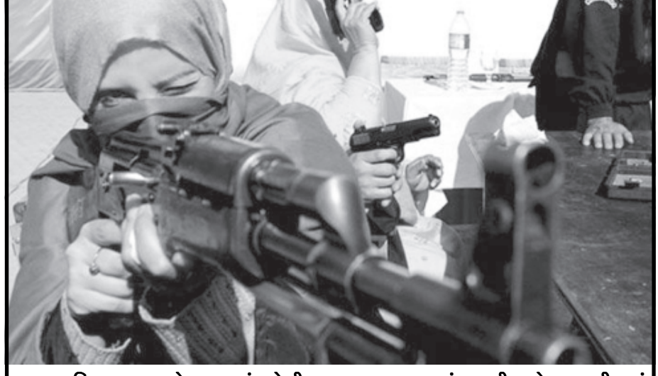
પાકિસ્તાનના પેશાવરમાં પોલીસ દ્વારા રાખવામાં આવી રહેલ તાલીમમાં એક શિક્ષિકાએ શસ્ત્ર તાલીમ મેળવી હતી. અમે ઉલ્લેખનીય છે કે ડિસેમ્બર માસમાં તાલીબાનોએ પેશાવરની આર્મી સ્કૂલમાં કહેલા ઘાતકી હુમલામાં ૧૫૦થી વધુ બાળકોની હત્યા કરી હતી તેના વિશ્વભરમાં ઘેરા પ્રત્યાઘાતો પડ્યા હતાં.