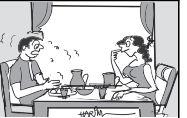
હવે, ... કુકીંગ કલાસમાં જઈને તને સંપૂર્ણ રસોઇ કરાવી આપવી ગઈ છે... હવે કીચર... કાલથી રસોઇયો રાખી લઈ તો કેવું..?