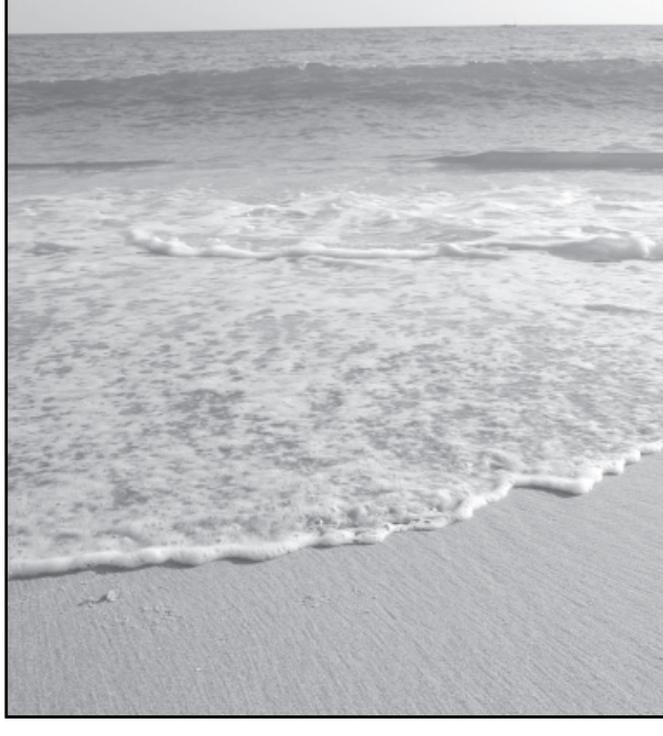
કોઈ કિંમત હોતી નથી, તે અમૂલ્ય છે. એક સામાન્ય મધ્યમવર્ગમાંથી આવનાર ઉત્સાહી ચુવાન ઈન્ફોસિસ થકી ભારતને વિશ્વના નક્શા પર તેજસ્વી, સમર્થ દેશ તરીકે મૂકે છે.

નારાયણમૂર્તિ કહે છે કે માત્ર વિચાર અને વાતો જ ન કરવી પરંતુ હંમેશા પોતાના વિચારોને સાકાર કરી અંતિમરૂપ આપી એને વાસ્તવિકતામાં પરિવર્તિત કરવું જોઈએ. જો તમારી પાસે કોઈ વિચાર છે તો નવરા બેસી ન રહો. તેને પ્રભાવી રીતે સમજાવો મૂકો. ઈન્ફોસિસનું નામ વિશ્વ ફલક પર અથાગ પરિશ્રમથી લઈ જનાર નારાયણમૂર્તિ ચુવાનોને સંબોધે છે કે - જે કંઈ કહો તે કરી દેખાડો. તમે કોઈને તમારા માર્ગ પર ચાલવાનું ત્યાં સુધી ના કહી શકો, જ્યાં સુધી તમે તેને એ બતાડવાની ક્ષમતા ન ધરાવો કે, તમે જે કંઈ કહો છો, તેના પર તમે મક્કમ પણ રહો છો. નારાયણમૂર્તિ દૃઢપણે માને છે કે જે લોકો હસતા જોવા મળે છે અને સ્મિતના બદલામાં સ્મિત આપે છે એ જ લોકો અંતે લક્ષ્ય પ્રાપ્ત કરી શકે છે. આનંદને સંપત્તિની જેમ વહેંચવો જોઈએ, તેની