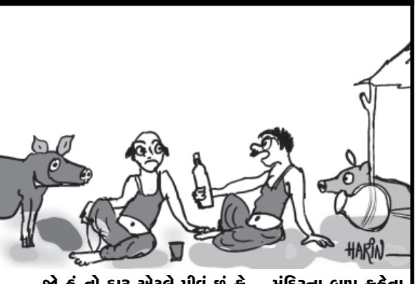
જો હું તો દારૂ એટલે પીવું છું કે... મંદિરના બાપુ કહેલા હતાં કે દારૂ પીવાથી કુસ્કર જેવા થઈ જવાયા... અને કુસ્કરને પોતાને સ્વાધન રૂબુ નથી થવું એવું વાંચ્યું હતું... !!