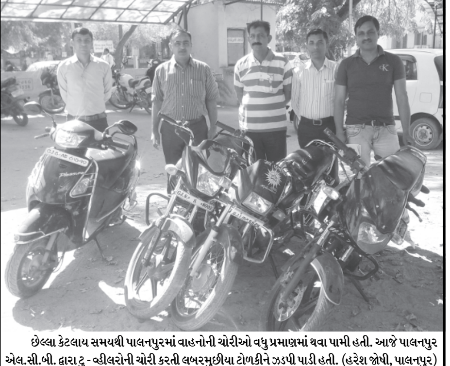
છેલ્લા કેટલાય સમયથી પાલનપુરમાં વાહનોની ચોરીઓ વધુ પ્રમાણમાં થવા પામી હતી. આજે પાલનપુર એલ.સી.બી. દ્વારા ટુ- વ્હીલરોની ચોરી કરતી લવરમુછીયા ટોળકીને ઝડપી પાડી હતી. (હરેશ જોષી, પાલનપુર)

(સમીર બલોચ) મોડાસા, તા.૯ અરવલ્લી જિલ્લા માં જાણે ગુનેગારો ને પોલીસ નો કોઈ ડર જ ના રહયો હોય તેમ દિવસે ને દિવસે અરવલ્લી જિલ્લા માં ગુનાખોરી ના પ્રમાણ માં સતત વધારો થતો રહયો છે ત્યારે ગઈકાલે રાત્રે બાયડ તાલુકા ના બીબીપુરા નજીક આવેલ પેટ્રોલ પંપ ઉપર રાત્રીના સમયે પાર્ક રેલ ટૂક માં થી ૨૦ મીનીટ માં જ ૨૦લાખ રૂપિયાના કોપર ની ચોરી થતાં સનસનાટી મચી ગઈ હતી. ગઈકાલે રાત્રીના સુમારે બાયડ તાલુકા ના બીબીપુરા ગામે પેટ્રોલ પંપ ઉપર વાપી થી કોપર અને ડાબર કંપની ના પાર્સલ ભરી ને ટૂક દિલ્હી જવા રવાના થઈ હતી ત્યારે આ ટૂક ડ્રાઈવર ધ્વારા રાત્રે આરામ કરવા માટે બાયડ ના બીબીપુરા નજીક આવેલ પેટ્રોલ પંપ ઉપર ટૂક પાર્ક કરી ને સુઈ ગય હતા ત્યારે તે દરમ્યાન કોઈ અજાણ્યા ચોરો એ આવી ને બાજુ માં ટૂક પાર્ક કરી ને ૨૦ જ મીનીટ માં ૨૦ લાખ રૂપિયાના કોપર ના બંડલ અને એક લાખ રૂપિયા ના ડાબર કંપની ના કાર્ટન મળી કુલ ૨૦૦ નંગ ઉપર ના કાર્ટન ની ચોરી કરી ને સનસનાટી મચાવી હતી ત્યારે આ અંગે ડ્રાઈવર અને કલીનર સવારે ઉઠી ને જોતા નાડ પત્રી ફટકેલી હતી અને અંદર થી કાર્ટન ચોરઈ જતાં હતપ્રત થઈ ગયા હતા અને જે અંગે તેમણે બાયડ પોલીસ સ્ટેશને પહોચીને આ અંગે ચોરી ની ફરીયાદ નોંધાવી હતી ત્યારે આ અંગે બાયડ પી.એસ.આઈ ધ્વારા ચોરી ની ફરીયાદ નોંધી આગળ ની કાર્યવાહી હાથ ધરી હતી.