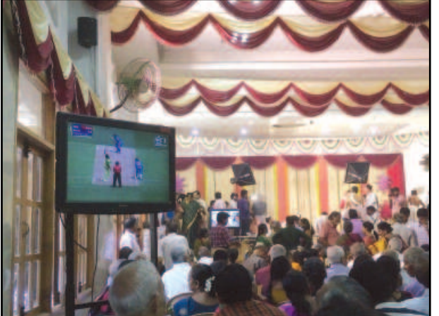
પરંપરાગત હરિક પાકિસ્તાન સાથે હોવાના કારણે ભરપુર લગનસરાની મોસમમાં પણ નગરજનો ક્રિકેટના રંગે રંગાયા હતા. રવિવારના રજાના દિવસે મેચ હોવાના કારણે ક્રિકેટપ્રેમીઓને આજે જલ્સો પડી ગયો હતો. અને તેમાં જ ભારતની ભવ્ય જીત થતા ક્રિકેટ રસિયાઓ આનંદમાં આવી ગયા હતા. અનેક

તમામ લગન સમારંભોમાં લોકો હાલમાં જરવાની થાળી પકડીને એકબીજા સાથે મેચની જ ચર્ચા કરતા જોવા મળ્યા હતા. ગાંધીનગરના કેટલાક લગન પ્રસંગોમાં તો રીતસર મોટા મોટા એલસીડી ટીવી સ્ક્રીન મુકીને મેચને લાઈવ પ્રદર્શિત કરાઈ