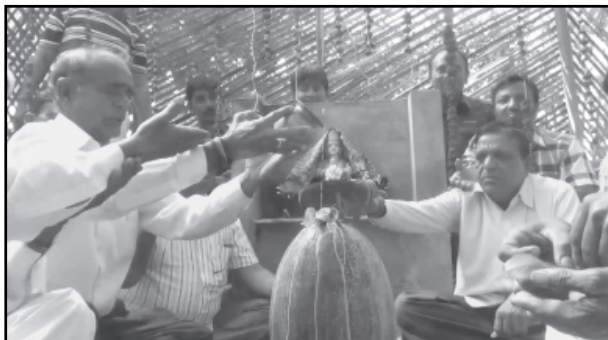
મહાશિવરાત્રીને લઈને અરવલ્લી જીલ્લામાં ઠેર ઠેર મેળાઓ લાગ્યા હતા

દરેક શિવ મંદિરોમાં પ્રસાદ રૂપે ભાંગનો પ્રસાદ વહેવવામાં આવ્યો હતો. જ્યારે મોડાસા ખાતે આવેલ ઘેબીનાથ મંદિરમાં ધીના મહાદેવ બનાવવામાં આવ્યા હતા જે મોડાસા શહેરના શિવભક્તોમાં આર્કષણનું કેન્દ્ર બન્યા હતા જ્યારે