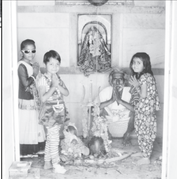
આજે શિવરાત્રી પર્વ માં જિલા મથક પાલનપુર, તેમજ વહેપારી મથક ડીસા સહિત અન્ય તાલુકા મથકો , અમીરગઢ, દાંતીવાડા, દાંતા, દિયોદર, કાંકરેજ, ભાભર, વાવ, થરાદ, સહિતના વિસ્તારોમાં શિવરાત્રી પર્વની ભક્તિભાવપૂર્ણ ઉજવણી કરાઈ હતી, આ સંગે બાલારામ, હરગંગેશ્વર, કોટેશ્વર, પાતાળેશ્વર સહિતના શિવમંદિરોમાં ભાવિકભક્તો દ્વારા પૂજા-અર્ચના કરવામાં આવી હતી, તો વળી, ડીસા માં રીસાલેશ્વર મહાદેવ મંદિર, રેજીમેન્ટ નીલકંઠ મહાદેવ, રસાણા શિવધામ તેમજ અન્ય શિવમંદિરો માં આજે સવાર-સાંજ આરતી તેમજ ભજન સત્સંગનો કાર્યક્રમ યોજાયો હતો. તો વળી, દાંતીવાડા તાલુકામાં આવેલા વિવિધ મહાદેવના મંદિરોમાં શિવરાત્રિને લઈને ભારે ધર્મમય માહોલ જામ્યો હતો. જેમાં કૃષિ

આજ ના પાવન દિવસે સહુ કોઈ શિવમય બની ઉપવાસ કરતા હોઈ ફલાહાર માં નિય એવા દિવસે શિવરાત્રી પર્વ નિમિત્તે ભાવિકભક્તો ઉપવાસ રાખતા હોય છે. ત્યારે વિવધ મંદિરો માં ભક્તજનો માટે ફલાહાર અને -સાદ ની પણ સુંદર વ્યવસ્થા રાખવામાં આવી હતી. આજે શિવરાત્રી નિમિત્તે સમગ્ર જિલ્લા માં અનેરો ભક્તિમય મહોલો જામ્યો હતો