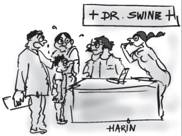
ડોક્ટર સાહેબ, બાબાને છીક આવે છે, વાઈફને તાવ આવે છે... અને મને નાક ગળે છે... તો સ્વાધન ફરુલા બધા લક્ષણ મળીને, અમને સ્વાધન ફરુલુ કહેવાય... ??