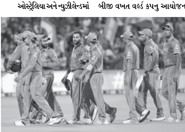
ઓસ્ટ્રેલિયા અને ન્યુઝીલેન્ડમાં બીજી વખત વર્લ્ડ કપનું આયોજન

હતા તે હાઈવોલ્ટેજ અને હાઈ પ્રોફાઈલ મેચ આવતીકાલે મેલબોર્ન ખાતે રમાનાર છે. મોટા ભાગના ક્રિકેટ ચાહકો માની રહ્યા છે કે આ મેચ વર્લ્ડ કપના ફાઈનલ મેચ જેવી મેચ રહેશે. મેલબોર્ન ખાતે આ મેચની તમામ ટિકિટ પહેલાથી જ વેચાઈ ચુકી છે. વિશ્વના એક અબજ કરતા પણ વધુ ચાહકો વર્લ્ડ કપની મેચનિહાળનાર છે. ૨૦૦થી વધારે દેશોમાં રહેતા ક્રિકેટ ચાહકો ઉત્સુકતાપૂર્વક વર્લ્ડ કપની રહ જોઈ રહ્યા છે.