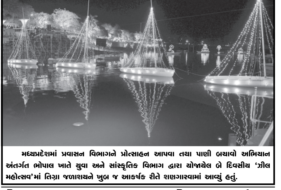
મધ્યપ્રદેશમાં પ્રવાસન વિભાગને પ્રોત્સાહન આપવા તથા પાણી બચાવો અભિયાન અંતર્ગત ભોપાલ ખાતે યુવા અને સાંસ્કૃતિક વિભાગ દ્વારા યોજાયેલ બે દિવસીય 'ઝીલ મહોલસવ'માં તિગા જળાશયને ખુબ જ આકર્ષક રીતે શણગારવામાં આવ્યું હતું.

નવી દિલ્હી, તા. ૨૧ સામાજિક કાર્યકર અને ગાંધીવાદી નેતા અણ્ણા હજારે આવતીકાલથી કરી એકવાર વિવિધ મુદ્દાઓને લઈને આંદોલન કરવા જઈ રહ્યા છે. અણ્ણા આવતીકાલથી બે દિવસ સુધી આંદોલન કરનાર છે. જેમાં મોટી સંખ્યામાં લોકો ઉમટી પડે તેવી શક્યતા છે. દિલ્હીના મુખ્યપ્રધાન અને એએપીના નેતા રવિન્દ્ર કેજરીવાલ આંદોલનમાં સામેલ થવાની અનેક વખત ઇચ્છા વ્યક્ત કરી ચુક્યા છે પરંતુ અણ્ણાએ આની તક આપી નથી. અલબત્ત અણ્ણાએ સહકાર આપવા માટે કહેવામાં આવ્યું છે. સૌથી રસપ્રદ બાબત એ છે કે અણ્ણાના આંદોલનમાં કેજરીવાલને મંચ પર જવાની મંજૂરી પણ આપવામાં આવશે નહીં. અણ્ણા ઐતિહાસિક જંતર મંતર પર આંદોલન કરનાર છે. પ્રામ અહેવાલ મુજબ અણ્ણા મોટી સરકારથી નાપુશ છે. તેમણે કહ્યું છે કે જ્યારે મે મહિનામાં કેન્દ્રમાં મોટી સરકાર આવી હતી ત્યારે કહેવામાં આવ્યું હતું કે અચ્છે દિન આનેવાલે હું પરંતુ હજુ સુધી આવા સારા દિવસો આવ્યા નથી. અણ્ણાએ કહ્યું છે કે તેઓ જમીન અધિગ્રહણ અને અન્ય મુદ્દે આંદોલન કરીને સરકાર પર દબાણ લાવશે. અણ્ણા કહી ચુક્યા છે કે મોટી સરકાર આવ્યા બાદ ગરીબોની તરફ ધ્યાન આપવામાં આવી રહ્યું નથી જ્યારે અમીરોને ધ્યાનમાં લઈને નિતી બનાવવામાં આવી રહી છે. આ આંદોલનના કારણે દેશમાં બે જુદા જુદા મત ધરાવતા લોકો જુદા જુદા વલણ અપનાવે તેવી શક્યતા છે. આંદોલન દરમિયાન કોઈ અનિચ્છનીય બનાવ ન બને તે માટે પણ પગલા લેવામાં આવ્યા છે. દિલ્હી પોલીસ પહેલાથી જ સજ્જ છે. અંધાધુંધીને ટાળવામાં આવશે. દિલ્હી સરકાર પર પણ દબાણ રહેશે.