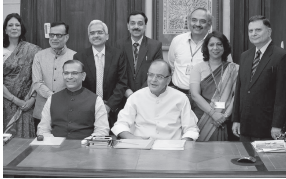
જણાવવામાં આવ્યું છે કે, આવનાર ટકા વધારે રહેવાનો અંદાજ છે. વૃદ્ધિદરને બે આંકડામાં લઈ જવાની

૫૨ જીડીપી વૃદ્ધિદર વર્ષ ૨૦૧૫-૧૬માં ૮.૧ ટકાથી ૮.૫ ટકા રહેવાનો અંદાજ છે. આમા