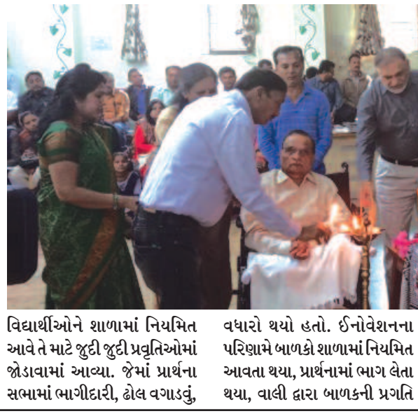
વિદ્યાર્થીઓને શાળામાં નિયમિત આવે તે માટે જુદી જુદી પ્રવૃત્તિઓમાં જોડાવામાં આવ્યા. જેમાં પ્રાર્થના સભામાં ભાગીદારી, ઢોલ વગાડવું,

શાળામાં વિદ્યાર્થીઓ દરરોજ આવે અને તેમને આર્થિક ઉપજીવન પણ મળે તે હેતુમાં કામ કર્યું. જેમાં તેઓએ શાળાની વિદ્યાર્થીઓને વેસ્ટમાંથી બેસ્ટ સુંદર ચીજવસ્તુઓ તૈયાર કરતા શીખવી હતી. અને સાથે સાથે અભ્યાસમાં પણ બાળાઓ દરરોજ આવવા લાગી હતી. તેઓને શિક્ષણની સાથે હવે વિવિધ ચીજવસ્તુ તૈયાર કરવામાં પણ રસ પડ્યો કારણ કે તેમાંથી તેઓને આર્થિક રીતે મદદ મળવા લાગી. જ્યારે શાળામાં નહીં આવવાનું કારણ તેઓની ધરમાં આર્થિક જરૂરીયાત હોવાથી મજૂરી કામ અર્થે જતી હતી. આ પ્રોજેક્ટથી ગામની તમામ વિદ્યાર્થીનીઓ શાળાએ નિયમિત આવતી થઈ ગઈ અને વિવિધ ચીજવસ્તુઓ ધરે તૈયાર કરીને ગામમાં અન્ય મહિલાઓને વેચાણ કરીને તેમાંથી આર્થિક જરૂરીયાત પૂરી થવા લાગી. કાકટમાં બંગડી સેટ, વિટી, બુટી, માળા, કંદોરા, પાનાવ, સહિતની ચીજવસ્તુઓ બનાવે છે.