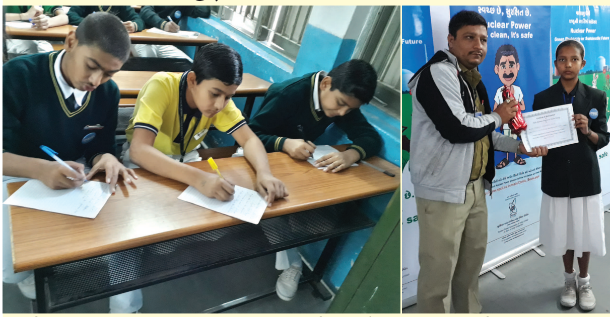
ઊર્જા વિષયે સૂત્રલેખન અને નિબંધલેખન સ્પર્ધા યોજાઈ : ૨૬૫ વિદ્યાર્થીઓએ ભાગ લીધો