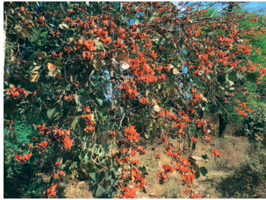
અરવલ્લી જિલ્લામાં સોળે કળાએ ખીલ્યો કેસુડો...

છે. પણ આ પ્રશ્ન વ્યવસ્થા કરનાર કચેરીની છે આતો 'પાડાના વાંકે પખાલીને ડામ' જેવો ઘાટ સર્જાયો છે. ત્યારે તંત્ર સત્વરે અને લોકોના કામો નિયત સમયે નિતિનિયમ પ્રમાણે ઝડપથી ઉકેલાય એવો જનમત પ્રવર્તી રહ્યો છે.