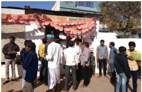
દાનેરામાં ભાજપ ચૂંટણી કાર્યાલયનું ઉદ્ઘાટન કરાયું

હિંમતનગરના આંબાવાડી વિસ્તારમાં રહેતા અને પૂર્વ ટ્રાક્ટીક