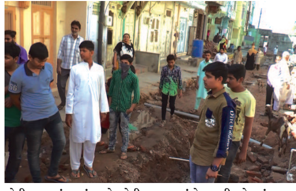
દોડી આવ્યાં હતાં અને દોડી આવેલ રહીશોએ ચીફ કામમાં વેઠ વાળી હોવાનું પ્રથમ નજરે જોવા મળ્યું હતું.

કામમાં વેઠ વાળી હોવાનું પ્રથમ નજરે જોવા મળ્યું હતું. ત્યારે બનાવેલ કુંડીઓ માત્ર નાની અને અંદર કુંડી પછી રીતે સીમેન્ટ કે તળીયું મારેલ નથી અને પાઈપો સીધે સીધાં મારી દેવામાં આવ્યા હતાં. ત્યારે આ અંગે ચીફ ઓફિસરને પુછતાં તેવો એ જણાવ્યું કે અમે સ્થળ ઉપર જઈને તપાસ હાથ ધરી છે અને રહીશોની રજુઆત પ્રમાણે તેમણે કુંડીઓ બનાવી આપીશું. ત્યારે હાલ તો ગટર લાઈન કામને લઈને છેલ્લાં એક મહિનાથી રહીશો મુશ્કેલીઓમાં મુકાયા છે. મોટી ઉંમરના રહીશોને ઘર બહાર નિકળવું પણ હાલ તો મુશ્કેલ બન્યું છે. ત્યારે હવે તેમની સમસ્યાનો નિકાલ ક્યારે આવશે એ તો હવે જોવાનું રહ્યું.