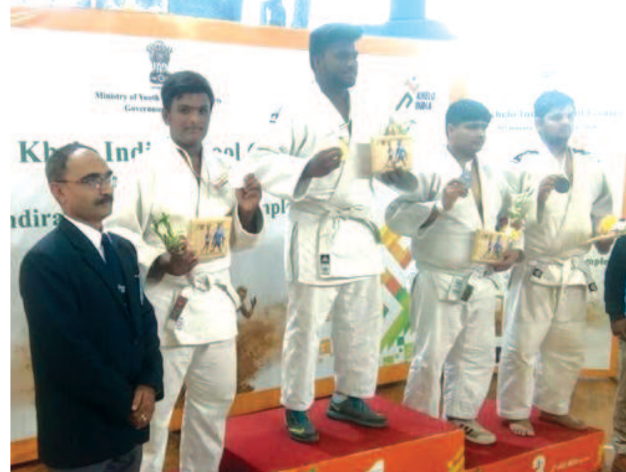
‘ખેલો ઈન્ડિયા’માં રાષ્ટ્રીય કક્ષાએ ૯૦ કિ.ગ્રા.માં સિલ્વર મેડલ