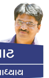
રજીપાટ અજય વિપાદયાય

...! અને ઈટ્સ ફેક્ટ કે સૌરાષ્ટ્ર જેવા ઓથેન્ટિક ગાંઠિયા તો માનને માત્ર સૌરાષ્ટ્રમાં જ મળે ...! ઈવન અમદાવાદ કે વડોદરા કે બીજે ક્યાય પણ ભલે ને બનાવનાર કાઠીયાવાહી હોય તો પણ સૌરાષ્ટ્રમાં મળતા ગાંઠિયાનો અસલ્લસ સ્વાદ મિશ્રિણ લાગે લાગે ને ઘાગે જ ...! અને એ તકાવત અનુભવવા માટે એકાદવાર ગાંડલા, રાજકોટના કે સૌરાષ્ટ્રના કોઈ પણ ગામના ગાંઠીયા ખાવા પડે...! આ લખનારના સ્વાદિષ્ટ નિરીક્ષણ પરથી એવું જણાવ મળે છે કે લીબડીથી જેમ જેમ સૌરાષ્ટ્ર બાજુ જતા જાવ એમ એમ ઉચા માથવા ગાંઠીયા મળતા થાય...! ડોન્ટ લાફ... આ હકીકત છે ...! લીબડીથી રાજકોટમાં મસ્તીના ગાંઠિયા મળે એનાથી આગળ જાવ તો ગાંડલાના ગાંઠીયા 'બેસ્ટ' ...એનાથી આગળ કેશોદ કે જુનાગઢ બાજુ એનાથીયે ટનાટના ગાંઠિયા...! અને આવા મસ્ત પોચા અને સ્વાદિષ્ટ ગાંઠીયા બનાવવામાં વોશિંગ પાઉટ વપરાય છે એવી વાતો તો વિરોધીઓનું કાવતરું છે... સખ્ત વિરોધે આપણો એ બાત પર ...!!! હકીકતે એનું કારણ કો-મટીરીયલ અને બનાવનારની હથોટી જ છે...! સકલ ભ્રાહ્માંડમાં તો નહિ પણ સકલ સૌરાષ્ટ્રમાં ગાંઠીયા 'હરી તારા નામ છે હજાર' ની જેમ અનેકો સ્વરૂપે મળે છે. આરખાર જોઈ શકાય એવા પારદર્શી અને મોમાં નાખો ત્યાં ઓગળી જાય એવા ફાફડા તો ઓલટાઈમ હીટ ને હીટ છે જ તો કમનીય વળાંકોવાળા વણેલા ગાંઠીયા તો સરેઆમ ઉપલબ્ધ હોય જ છે પણ એ સિવાય પણ ફાફડાના મીની સ્વરૂપ જેવી તીખી અને મોબી બંને સ્વાદમાં ઉપલબ્ધ પાપડી પણ એટલી જ ફેમસ છે. ભાવનગર બાજુ જ્યાંબંધ મરી નાખેલા ભાવનગરી ગાંઠીયા