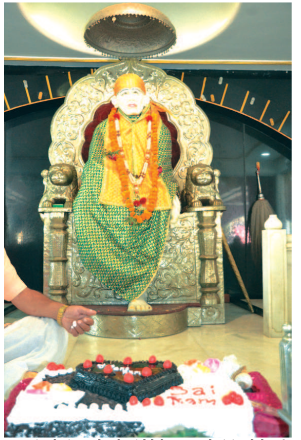
સંત તો સંત જ હોય છે. સંતોને દેશકાળ સાથે સંબંધ હોતો નથી. ગાંધીનગર સાંઈ ભક્ત મહિલા દ્વારા વેલેન્ટાઈન ડે નિમિત્તે સંત વેલેન્ટાઈનની સ્મૃતિમાં સંત સાંઈ બાબાને સેક્ટર-૩૦માં આવેલા સાંઈ મંદિરમાં કેકની પ્રસાદી ધરવામાં આવી હતી. શ્રી સાંઈ બાબા સમાવિસ્ત થયા તેને અકોટોબર ૨૦૧૮માં સો વર્ષ પૂર્ણ થશે. જે નિમિત્તે સાંઈ સંસ્થા દ્વારા ભવ્ય ઉજવણી કરવાનું આયોજન પણ કરવામાં આવેલ છે.

દેશના જુદા જુદા રાજ્યોમાથી ખ્યાતી પ્રાપ્ત ૧૮ જેટલા કલાવૃદ્ધોને નિમંત્રણ છે. જેમાં રાજસ્થાનનું કાલબેલિયા અને ભાવણ વાદન, મહારાષ્ટ્રનું ધનગરી ગજા અને લેજમ, ગોવાનું ઉત્તર પ્રદેશનું ડેડિયા નૃત્ય, નાગપુરનું બરેડી અને આદિવાસી નૃત્ય, આસામનું બીહુ, પુંગ ઢોલ, ચિલમ, કલકત્તાનું ગોટીપુઆ, પુરૂબિયા મુખ્યત્વે છે. આ ઉપરાંત આદિજાતિ કલાવૃદ્ધોમાં રોજેરોજ બનાવકાંઠાનું જગજગેરા નૃત્ય, છોટા ઉદેપુરનું રાઠવા નૃત્ય, નર્મદાનું આદિજાતી લગન નૃત્ય ડાંગનું કહાડિયા નૃત્ય, દાહોદ તાપીનું આદિજાતી નૃત્ય તથા ભરૂચ જિલ્લાનું સિદી ધમાલ નૃત્યનું રસપાન કરવામાં આવશે. ગુજરાતનો છેલ્લો બિલો છડીદાર, રહિયાળા તુરી બારોટ સમાજની વાત પણ નિરાલી છે. ભુમ થી આ લોક ભોગ્ય કલાને જિવંત રાખવા દર વર્ષે આ કલાકારોની લોક ગચકી, લોક સાહિત્ય, લોક સંગીતની ઝાંખી કરવામાં આવે છે. કચ્છી ઘોડી, મેવડો લોક નૃત્ય, ભવાઈ, વેરાડી ઝુલણા, સળગતો ગરબો, હાથીનો વેશ, રાવણ હથોથો, ઢોલ, મહિસાસુરનો વધ અને સનેડો મુખ્યત્વે છે.