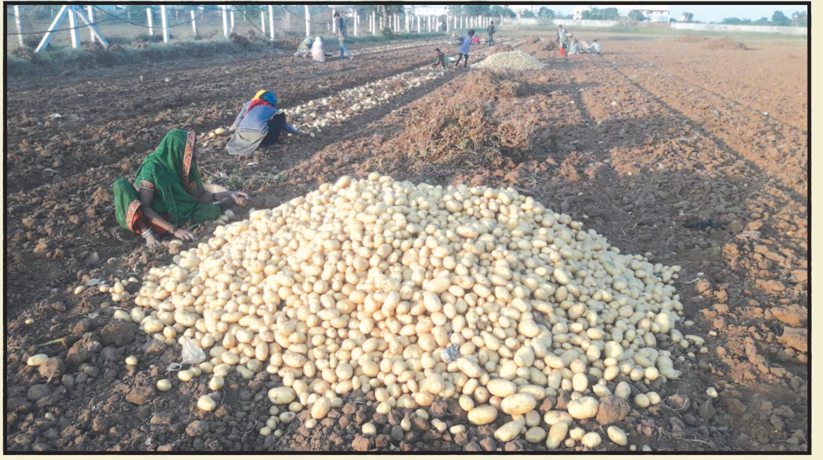
બનાસકાંઠામાં નવા બટાટા કાઢવાના શ્રીગણેશ...! બટાટાના વાવેતર માટે દેશભરમાં જાણીતા ડીસા પંથકમાં દર વર્ષની જેમ આ વર્ષે પણ બટાટાનું વિપુલ પ્રમાણમાં વાવેતર થયા બાદ બટાટાનો પાક તૈયાર થઈ જતા ખેડૂતોએ નવા બટાટા કાઢવાના શ્રી ગણેશ કરી દીધા છે. બટાટા કાઢવાની સિઝન ખુલતા શ્રમજીવીઓ પણ મજૂરીકામમાં વ્યસ્ત થઈ ગયા છે.

હિંમતનગર, તા. ૧૪ હિંમતનગર સહિત સાબરકાંઠા જિલ્લાના ગોરવમાં વધુ એક મોરપીંછ ઉમેરાયુ છે ત્યારે હિંમતનગરમાં આવેલ હાથમતી કેનાલ પર નગરપાલિકા દ્વારા કરોડો રૂપિયાના ખર્ચે વ્યવસાયિક હેતુ માટે અદ્યતન સગવડો સાથેની દુકાન ઓફીસો તૈયાર કરાઈ છે. ત્યારે હિંમતનગર સહિત જિલ્લાવાસીઓમાં આ નહેર નથી પણ લહેર છે વિકાસની જે સાહસિકોની ભાગ્યરેખા ભવિષ્યમાં પુરવાર થનાર છે. ત્યારે નગરપાલિકાએ કેનાલ ફ્રન્ટ પર બનાવાયેલ ઓફીસો અને દુકાનોની હરાજી આગામી તા. ૧૮ ફેબ્રુઆરીના રોજ થશે.