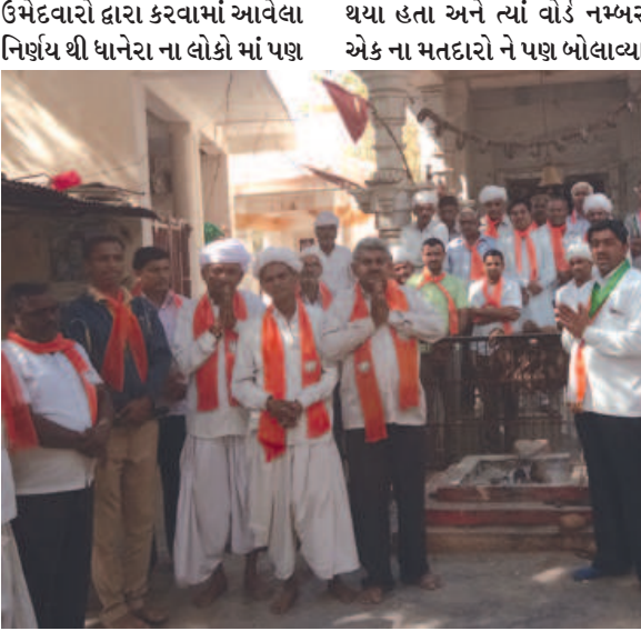
દાનેરા નગરપાલિકા ની ચૂંટણી પ્રચાર ને શાંત થવા આડે હવે માત્ર એકજ દિવસ બાકી છે ત્યારે બંને પક્ષ ના ઉમેદવારો જીતવા માટે એડી ચોટી નું જોર લગાવી રહ્યા છે પણ દાનેરા નગરપાલિકા વોર્ડ નંબર એક ના ઉમેદવારો દ્વારા કરવામાં આવેલા નિષ્ણય થી દાનેરા ના લોકો માં પણ થયા હતા અને ત્યાં વોર્ડ નમ્બર એક ના મતદારો ને પણ બોલાવ્યા રૂપિયા નો દંડ પણ કરશું. ગુજરાત માં ચૂંટણી ભલે પુષ્કળ પ્રમાણ માં દારૂ પીવડાવતા હોય છે અને લોકો પાસેથી માટે લેતા હોય છે પરંતુ દારૂ ના નશા માં લોકો બબાલ કરે છે અને તેમને મોટા પાયે નુકશાન પણ થતું હોય છે ત્યારે વોર્ડ નંબર એક ઉમેદવારો ના નિષ્ણય થી દાનેરા ના લોકો માં પણ ખુશી પણ જોવા મળી રહી છે અને લોકોએ પણ આ નિષ્ણય ને સ્વીકારી લીધો છે ગાંધી ના ગુજરાત માં આમ તો દારૂ બાંધી છે પરંતુ જો એમ કહેવામાં આવે કે અન્ય રાજ્ય કરતા ગુજરાત માં દારૂ ના વેશન કરતા લોકો ગુજરાત માં વધારે છે તો તે વાત ને પણ નકારી શકાતી નથી ત્યારે દાનેરા વોર્ડ નંબર એક ના ઉમેદવારો અને મતદારો ને જોઈ અન્ય લોકો પણ આ વાત ને સ્વીકારે તો ગાંધી ના ગુજરાત માંથી ૧૦૦ ટકા દારૂ ને ભગાડી શકાય.

આમ તો ચૂંટણી માં દારૂ ની રેલમ છેલ જોવા મળતી હોય છે અને ઉમેદવારો જીતવા માટે પુષ્કળ પ્રમાણ લોકો ને દારૂ પીવડાવતા હોય છે ત્યારે આજે દાનેરા નગરપાલિકા ની સામાન્ય ચૂંટણી માં વોર્ડ નંબર એક ના ભાજપ અને કોંગ્રેસ બંને પક્ષ ના ઉમેદવારો ધ્વરા લોકોને દારૂ ન આપવા માટે સોગંધ વિધિ કરી છે તો બીજી તરફ લોકોએ પણ આ વાત સ્વીકારી છે અને જે દારૂ આપે તેને એક લાખ દંડ કરવાની પણ જોગવાઈ કરી છે.