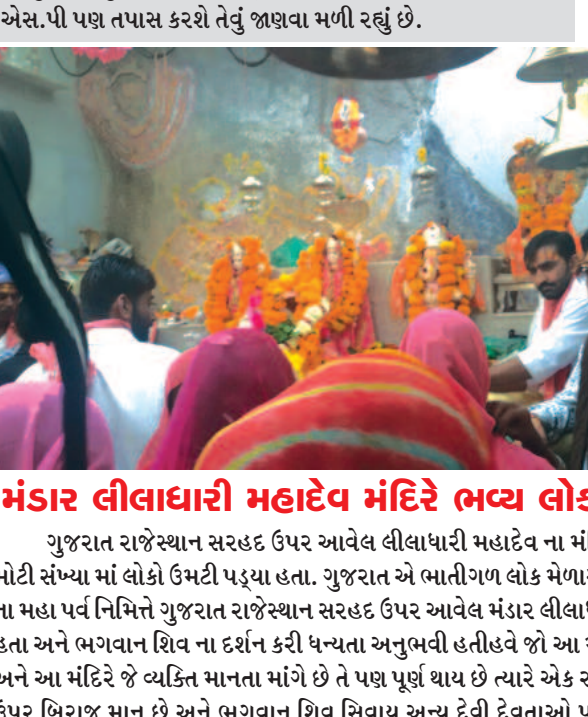
મંડાર લીલાધારી મહાદેવ મંદિરે ભવ્ય લોકમેળો ભરાયો