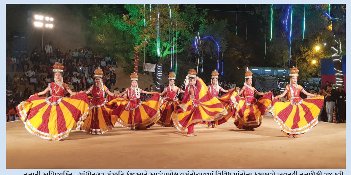
નૃત્યની અભિવ્યક્તિ - ગાંધીનગર સંસ્કૃતિ કુંજ ખાતે આરંભાયેલ વસંતોત્સવમાં વિવિધ પ્રાંતોના કલાકારો અવનવી નૃત્યશૈલી રજૂ કરી પ્રેક્ષકોના મન મોહી લે છે... દરરોજ રાત્રે યોજાતા નૃત્યોત્સવમાં નૃત્યોની અભિવ્યક્તિ માણવા ગાંધીનગર અને આસપાસના કલાપ્રેમીઓ ઉમટે છે... સાથે સાથે રાજથી જ સંસ્કૃતિ કુંજ ખાતે વિવિધ સ્ટોલ પર વિવિધ કલાકૃતિઓની ખરીદીમાં પણ ભારે ભીડ જોવા મળે છે...