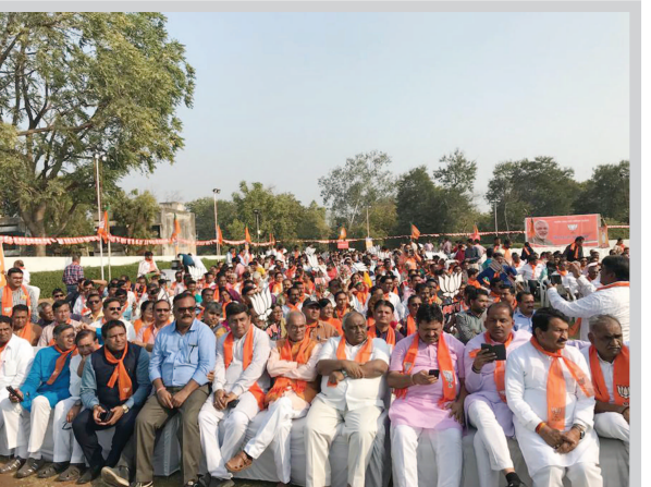
વિજયભાઈ રૂપાણીએ જણાવ્યું હતું કે કલસ્ટર સંમેલન એ પાયાનું સંમેલન છે, ભાજપની તાકાતએ કાર્યકર્તાઓની છે. ભારત વિશ્વગુરુ બને તેની પ્રતિષ્ઠા વધે,