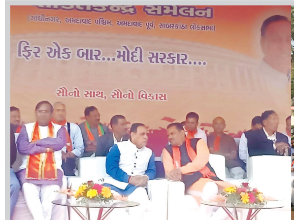
આયોજનને મજબુત બનાવવા માટે કલસ્ટર સંમેલનનું આયોજન કરવામાં આવ્યું છે. જેમાં આજે ગાંધીનગર શહેરના સેક્ટર-૧૬ અમદાવાદ પશ્ચિમ લોકસભાના યોજાયેલા કલસ્ટર સંમેલનમાં મોટીસંખ્યામાં કાર્યકરો હાજર રહ્યા હતા. આ શક્તિ કેન્દ્ર સંમેલનમાં વાઘાણીએ માર્ગદર્શન અને દોરવણી આપી આગામી બે ત્રણ માસ કામે લાગી જવા આહ્વાન કર્યું હતું.

ગાંધીનગર, તા.૩ આગામી લોકસભાની ચૂંટણીને અનુલક્ષી ભાજપ દ્વારા સમગ્ર ભારતભરમાં બુથ સુધીના રંગમંચ ખાતે બપોરના સુમારે ચાર લોકસભાનું પ્રથમ કલસ્ટર સંમેલન યોજાયું હતું. ગાંધીનગર, સાબરકાંઠા, અમદાવાદ પૂર્વ અને ઉપસ્થિત કાર્યકરોને લોકસભાની ચૂંટણીને ધ્યાને રાખી રાજ્યના મુખ્યમંત્રી વિજયભાઈ રૂપાણી અને પ્રદેશ પ્રમુખ જીતુભાઈ શહેરના સેક્ટર-૧૬ રંગમંચ ખાતે આયોજિત શક્તિ કેન્દ્ર સંમેલનમાં ઉપસ્થિત કાર્યકરોને સંબોધતા રાજ્યના મુખ્યમંત્રી અને તેની પ્રતિષ્ઠા વધે,