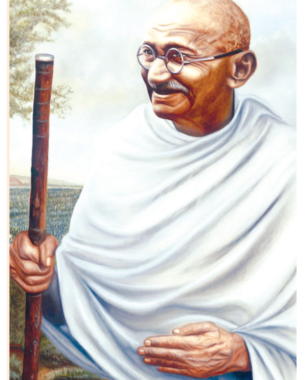
‘સત્યના પ્રયોગો’માંથી સાભાર

બાળકોને માર મારીને શીખવવાની સામે હું હમેશાં રહ્યું છું. એક જ પ્રસંગ મને યાદ છે કે જ્યારે મેં મારા દીકરાઓમાંથી એકને માર્યો હતો. આંકણી મારવામાં મેં યોગ્ય કૃત્ય કે કેમ તેનો નિર્ણય આજ લગી હું કરી નથી શક્યો. આ દંડની યોગ્યતાને વિષે મને શંકા છે, કેમ કે તેમાં કોપ ભર્યો હતો અને દંડ કરવાનો ભાવ હતો. જો તેમાં કેવળ મારા દુ:ખનું જ પ્રદર્શન હોત તો હું એ દંડને ગણતરું. પણ આમાં રહેલી ભાવના મિશ્ર હતી. આ પ્રસંગ પછી તો હું વિદ્યાર્થીઓને સુધારવાની વધારે સારી રીત શીખ્યો. એ કળાનો ઉપયોગ મેં મજકૂર પ્રસંગે કર્યો હોત તો કેવું પરિણામ આવત એ હું નથી કહી શકતો. આ પ્રસંગ પેલો યુવક તો તુરત ભૂલી ગયો. તેનામાં બહુ સુધારો થયો એમ હું કહી શકતો નથી. પણ એ પ્રસંગે મને વિદ્યાર્થી પ્રત્યેના શિક્ષકના ધર્મને વધારે વિચારતો કરી મુક્યો. ત્યાર બાદ એવા જ દાષ યુવકોના થયા. પણ મેં દંડનીતિ ન જ વાપરી. આમ આત્મિક જ્ઞાન આપવાના પ્રયત્નમાં હું પોતે આત્માના ગુણને વધારે સમજવા લાગ્યો.