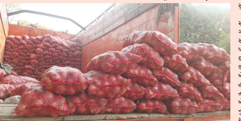
હોવાથી ગુહિણીઓમાં ભારે રોષ પ્રવર્તી રહ્યો છે. નાસિકના ખેડૂતો ટૂકમાં ડુંગરી ભરી મોડાસા શહેરના

છે. બીજી બાજુ ડુંગળી પકવનાર ખેડૂતોને ૪૦ થી ૭૦ રૂપિયા મળી