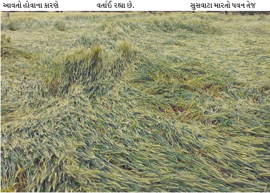
આવતો હોવાના કારણે વર્તાઈ રહ્યા છે. સુસવાટા મારતો પવન તેજ

છે. જો કે મોસમ ખુશનુમા છે, પરંતુ હરવા ફરવાના શોખીનો માટે એકદરે વાતાવરણ સાડું છે. ગાત્રો શ્રીજવતી ઠંડીના પગલે બજારોમાં ભારે સનાટો જોવા મળી રહ્યો છે. મોડી રાત સુધી લટારો મારવા ફરવા વાળા કાતીલ ઠંડીના કારણે જલદી ઘર ભેગા થઈ જવા માટે મજબુર છે. સુસવાટા મારતા બર્ફીલા પવનને કારણે ઠંડીએ એકાએક સપાટો બોલાવ્યો છે. કાતીલ તીવ્ર ઠંડીનું મોઝુ ફરી વળતાં શીત લહેર છવાઈ છે. ઉત્તર ભારતમાં ભારે હિમ વર્ષા થઈ હોવાના કારણે ઠેર-ઠેર બરફની યાદર છવાઈ ગઈ છે. વેસ્ટર્ન ડિસ્ટર્બન્સના કારણે વાતાવરણમાં પલટો વારંવાર