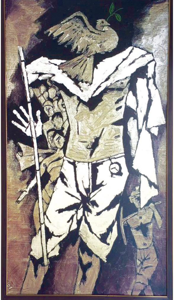
ગાંધીજી લિખિત 'આરોગ્યની યાત્રી'માંથી સાભાર