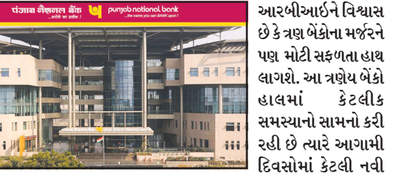
આરબીઆઈને વિશ્વાસ છે કે ત્રણ બેંકોના મર્જને પણ મોટી સફળતા હાથ લાગશે. આ ત્રણેય બેંકો હાલમાં કેટલીક સમસ્યાનો સામનો કરી રહી છે ત્યારે આગામી દિવસોમાં કેટલી નવી સમસ્યા ઉભી થઈ શકે છે. સુત્રોનું કહેવું છે કે જ્યાં સુધી આ બેંકો વસુલીને લઈને યોગ્ય રસ્તા પર આવતા નથી ત્યાં સુધી સરકાર કોઈ પણ નિર્ણયને લઈને રાહ જોશે. એમ માનવામાં આવે છે કે આ ત્રણેય બેંકોના ગ્રાહકોને નવી બેંકમાં પોતાના ખાતા નવેસરથી ખોલવાના રહેશે. આના કારણે પેપર વર્કની કામગીરી વધારે મુશ્કેલરૂપ બની જશે.

પંજાબ નેશનલ બેંક, ઓરિયન્ટલ બેંક ઓફ કોમર્સ તેમજ પંજાબ એન્ડ સિંધ બેંકને મર્જ કરવા માટેની તમામ તૈયારી નવી દિલ્હી, તા. ૮ સ્ટેટ બેંક ઓફ ઈન્ડિયા અને બેંક ઓફ બરોડામાં અન્ય બેંકોના મર્જની પ્રક્રિયા બાદ હવે સરકાર અન્ય ત્રણ બેંકોના મર્જને લઈને પણ તૈયારીમાં છે. ટુંક સમયમાં જ ત્રણ અન્ય બેંકોનું વિલિનિકરણ કરવામાં આવનાર છે. રિપોર્ટમાં કહેવામાં આવ્યું છે કે કેન્દ્ર સરકાર પંજાબ નેશનલ બેંક ઓરિયન્ટલ બેંક ઓફ કોમર્સ તેમજ પંજાબ નેશનલ બેંકને વિલિન કરવાની ઈચ્છા ધરાવે છે. જે કે આ સંબંધમાં નાણાં પ્રધાન અરૂણ જેટલી સ્વદેશ પરત કર્યા બાદ અંતિમ નિર્ણય કરવામાં આવશે. એવો અંદાજ છે કે આ ત્રણ બેંકોના મર્જ થવાના કારણે નવા બેંકની કુલ જમા રકમનો આંકડો ૧૬.૫ લાખ કરોડ રૂપિયાની આસપાસ પહોંચી જશે. જેમાં ડિપોઝિટ ૯.૬ લાખ કરોડ રૂપિયા અને લોન સાત કરોડ કરોડનો સમાવેશ થાય છે. પાંચ સહાયક