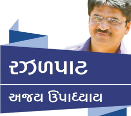
રઝખાપટ અજીય ઉપાધ્યાય

અને આમેય વેલેન્ટાઈનના પ્રેમ તો જિંદગીના ' કેટલી વિદે સો થાય ' ના તોફાનોમાં ટેકી જાય તો જ ટેડી ને રોઝ .... ચોકલેટ ને પ્રોમિસનું મહત્વ સમજાય બાકી તો મારા ભાઈ/બોન ' ૧૪ મીએ એટલે સાલ્વુ ક્યાંક કોઈકને આપણી પર પરાણે ઓળખોળ કરાવવાવાળા માટે તો નરકમાં ય જગ્યા નથી હોતી (આવું શારરોમાં લખવાનું રહી ગયેલું - અહીં એટલે જ એડ કર્યું ...!) બરાબર છે કે જુવાનીના જોશમાં કે પછી ક્ષણિક આકર્ષણમાં ' કોઈ અપના સા ' લાગવા માંડે તો એમાં વાંક તમારા કરતા વાસંતી વાયરાનો વધુ હોય શકે છે પણ વસંતપંચમીના અસલ યોગપડા ઉભેળો તો સમજાય કે પ્યાર બોલે તો રીસ્પેક્ટ... ઓર રીસ્પેક્ટ બોલે તો દિલથી દિલ મળે અને ઉમરના આકર્ષણથી પણ થઈને એકબીજાને ગમતા રહેવું ચોટી તો ..!!!! સીધી વાત છે ને પ્રેમ તે કાઈ ' આકળ વ્યાકુળ કાન ને વરસાદ ભીજવે ' જેવી ઘટના થોડી છે ? એ તો અનુભવવાની ચીજ છે .. ઈટ્સ ઓલ એબાઉટ ફીલિંગ બ્રો/સીસે ...!!! બીકોઝ શારીરિક આકર્ષણ તો સમય સાથે સરી જવાનું અને શાશ્વત અને સતત જો કશું સાથે રહેવાનું તો એ હશે માનસિક સાયુજ્ય .....દિલ સે દિલ કા ડાયરેક્ટ કનેક્શન ...બોલ્યા વિના સમજી જાય એવી આંખો અને એકસાથે ધડકે એવા જીગર ..!!!!