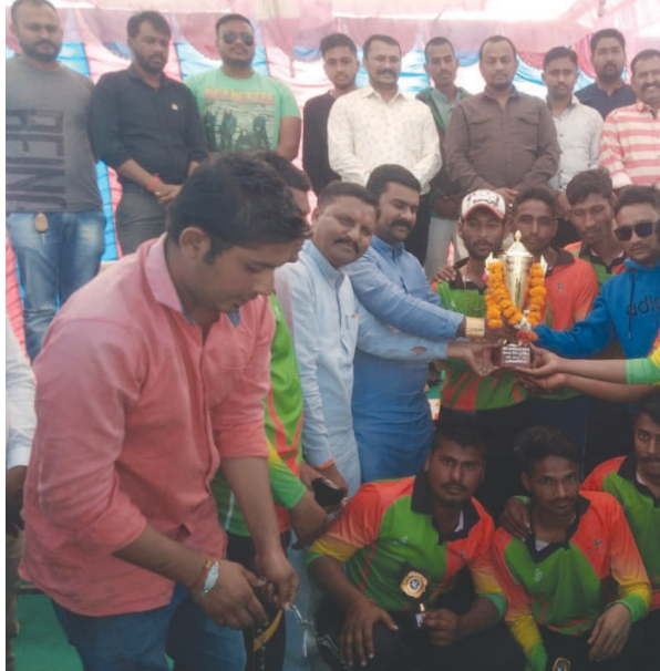
અરવલ્લીના રંગપુર ખાતે ક્રિકેટ ટુર્નામેન્ટનો ચોથો દિવસ