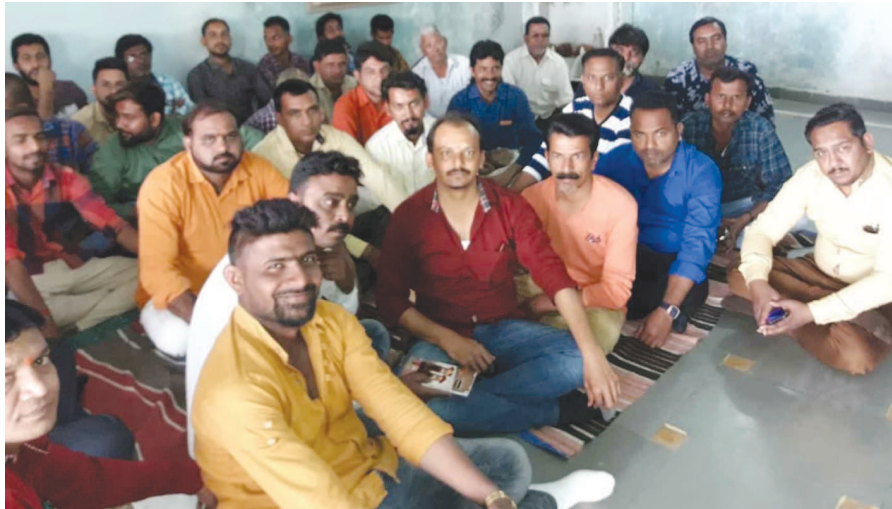
મિલોડા સલુન એસોસિએશનના નવિન હોદ્દાઓની નિમણૂક