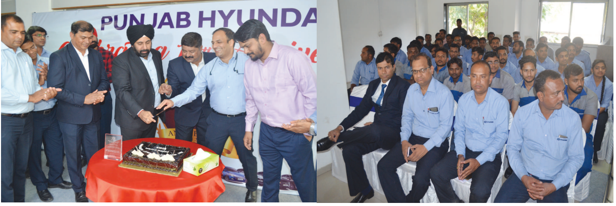
સે-૨૮ જીઆઈડીસી સ્થિત પંજાબ હુન્ડાઈ દ્વારા વર્ષ ૨૦૧૮ દરમિયાન શ્રેષ્ઠ કામગીરી કરનાર કર્મચારીઓને સન્માનપત્ર એનાયત કરી પ્રોત્સાહિત કરાયા હતા. પંજાબ હુન્ડાઈની ડિવરશીપને અગિયાર વર્ષ પૂર્ણ થતા આ તબક્કે કેક કાપીને ઉજવણી કરવામાં આવી હતી. પંજાબ હુન્ડાઈના કર્મચારીઓએ આ પ્રસંગે હર્ષની લાગણી વ્યક્ત કરી હતી.