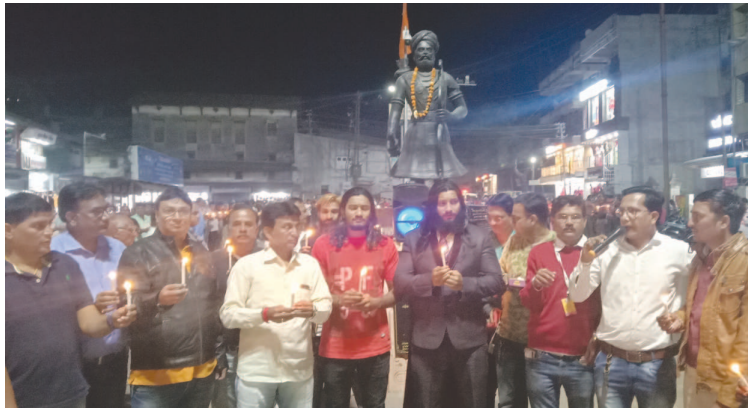
જમ્મુ-કાશ્મીર પુલવામામાં થયેલ ભયંકર આતંકવાદી હુમલામાં મોટી સંખ્યામાં શહીદ થયેલ ભારતીય સી.આર.પી.એફ.ના સૈનિકો માટે દુઃખ વ્યક્ત કર્યું હતું. કેન્ડલ માર્ચ યોજાઈ હતી. જેમાં ભાજપ અને કોંગ્રેસના કાર્યકરો અને મહેસાણા જનતા અને સામાજિક કાર્યકરોએ અલગ અલગ કેન્ડલ માર્ચ યોજી હતી અને સૂતોચ્ચાર કર્યા હતા. શનિવારે મહેસાણા સ્વયંભુ રાજમહેલ રોડ બંધ રહેવા પામ્યો હતો.