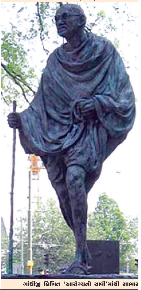
ગાંધીજી લિખિત 'આરોગ્યની ચાવી'માંથી સાભાર

આ સ્નાનને વિશે ક્યુનેની દલીલ આ છે : રોગનું ગમે તે બાહ્ય ચિકિત્સા હોય, પણ તેનું આંતરિક કારણ એક જ હોય છે. આંતરડાનો તાવ અંદરની ગરમીને અનરૂપે બહાર પ્રગટાવે છે. આ આંતરિક તાવ કટિસ્નાનથી અવશ્ય ઊતરે છે ને તેથી બહારના અનેક ઉપદ્રવો શાંત થાય છે. આ દલીલમાં કેટલું તથ્ય છે એ હું ન કહી શકું. એ તો અનુભવી દાક્તરો બતાવી શકે. પણ જો કે નૈસર્ગિક ઉપચારોમાંથી કોઈ દાક્તરોએ લીધેલું છે છતાં એમ કહી શકાય કે એ ઉપચારો વિશે તેઓ ઉદાસીન રહ્યાં છે. આમાં બંને પક્ષના દોષ હોઈ છે. દાક્તરો પોતાની શાળા વાટે જે શીખે જ તે જોવાની ટેવ કેળવે છે, એટલે બહારનું જે હોય તેને વિશે તિરસ્કાર નહીં તો ઉદાસીનતા તો અવશ્ય બતાવે છે. નૈસર્ગિક ઉપચારકો દાક્તરોને વિશે તિરસ્કાર કેળવે છે અને પોતાની પાસે શાસ્ત્રીય જ્ઞાન ચોઈ હોવા છતાં દાવો બહુ મોટો કરે છે. ઉપચારકો સંઘશક્તિ કેળવતા નથી. કેમ કે સહુને પોતાની પાસે રહેલી મૂંઝવણ સંતોષે છે. તેથી સાથે મળીને કામ નથી કરી શકતા. કોઈના પ્રયોગ ઊંડે જતાં નથી. કોઈ નમ્રતા કેળવતા નથી. (નમ્રતા કેળવી શકાતી હશે ખરી ?) આમ કહીને હું નૈસર્ગિક ઉપચારકોને વગોવવા નથી ઈચ્છતો. વસ્તુસ્થિતિ બતાવું છું. જ્યાં સુધી એઓમાંથી કોઈ અત્યંત તેજસ્વી માણસ ઉત્પન્ન નહીં થાય ત્યાં લગી સ્થિતિ બદલાવવાનો સંભવ થોડો છે. સ્થિતિ બદલાવવાનો બોજો ઉપચારકો ઉપર છે. (કમશઃ)