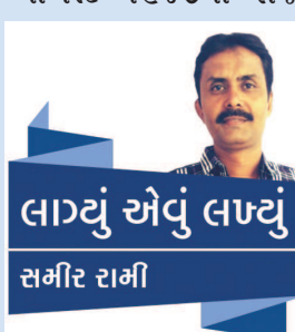
લાવડું એવું લાવડું સમીર તમીર

વાલીઓ માટે પુસ્તક પ્રદર્શનો યોજાયા અને ૭૦૪૫ શાળાઓમાં વિચારમંળા યોજાયા. ૫ લાખથી વધુ વાર્તાલાપ યોજાયા અને ૨૪,૪૪૬ શાળાઓના ૨૮.૧૨ લાખ વિદ્યાર્થીઓએ ૬૭.૦૫ લાખ જેટલા પુસ્તકોનું વાંચન કર્યું હતું. રાજ્યના ૨૦ જિલ્લામાં ૫૦૪૬ જેટલા ગ્રંથમંદિરોના નિર્માણ થયા અને રાજ્યની ૫૦૫ કોલેજોમાં ૭૮,૯૨૪ વિદ્યાર્થીઓએ ૬૫૫ જેટલા શેરી વાર્તાલાપો કર્યા હતા. 'વાંચે ગુજરાત' અંતર્ગત તરત પુસ્તક યોજના હેઠળ રાજ્યમાં ૩.૩૬ લાખ પુસ્તકો તરતા મુકાયા જેમાંથી ૧.૪૧ લાખ પુસ્તકો વિવિધ પુસ્તકાલયોને પ્રાપ્ત થયા અને ગામે ગામ મુખ્યમંત્રી સહિત નાગરિકો વ્યક્તિગત કે સમૂહવાચન પ્રક્રિયામાં ઉભળકાભેર જોડાયા હતા. સમગ્ર અભિયાનમાં ૨.૪૪ લાખ જેવી શાળાઓના ૨૮.૧૨ લાખ વિદ્યાર્થીઓએ ભાગ લઈ ૬૭.૦૫ લાખ જેટલા પુસ્તકોનું વાંચન કર્યું તેમજ રાજ્યમાં કુલ રૂ. ૧.૧ કરોડની કિંમતના ૧ લાખ જેટલા ઈનામો પુસ્તકો અને સામયિકના લવાજમ પેટે અપાયા હતા. રાજ્યભરમાં વાંચન પ્રત્યે એક અનોખો ઉત્સાહ પ્રસરી વ્યવ્યો હતો કે શહેર કે ગામડામાં ચોરે ને ચોરે નાગરિકો વાંચનમાં જોડાયા હતા. આ સફળ અભિયાનને રાજ્ય સરકાર દ્વારા કેમ ચાલુ ના રખાયું તે આશ્ચર્યનો વિષય છે કારણ કે આ અભિયાનમાં સરકારને અન્ય અભિયાનની તુલનામાં અત્યંત ઓછો ખર્ચ થયો હતો. 'વાંચે ગુજરાત' અભિયાન દરમિયાન અનેક સુત્રો પણ વહેતા કરવામાં આવ્યા હતા જેમ કે 'બુકે નહીં, બુક', 'પુષ્પ નહીં, પુસ્તક', 'ચાલો નહીં ચોપડી', 'ગ્રંથ દેખાડો પંથ', 'વાંચે ગુજરાત-જાગે ગુજરાત' અને ભાળકોને ગમતું સુત્ર હતું 'જે પુસ્તકનો મિત્ર, તે મારો પણ મિત્ર'. આજે વિશ્વ માતૃભાષા દિવસના પરિપ્રેક્ષ્યમાં ગુજરાતી ભાષાને ઉન્નત શિખરે પહોંચાડવા ભાષાપ્રેમીઓ પુછી રહ્યા છે કે 'શું ફરી એકવાર કેમ ના વાંચે ગુજરાત?'