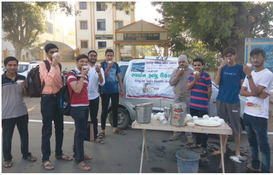
રાજ્યમાં સ્વાઈન ફ્લુનો રોગચાળો વધ્યો છે ત્યારે નગરજનો માટે સોરાષ્ટ્ર પટેલ સેવા સમાજ દ્વારા વિના મૂલ્યે સ્વાઈન ફ્લુના ઉકાળાનું વિતરણ કરવામાં આવ્યું હતું. જેનો નાગરિકોએ મોટી સંખ્યામાં લાભ લીધો હતો.