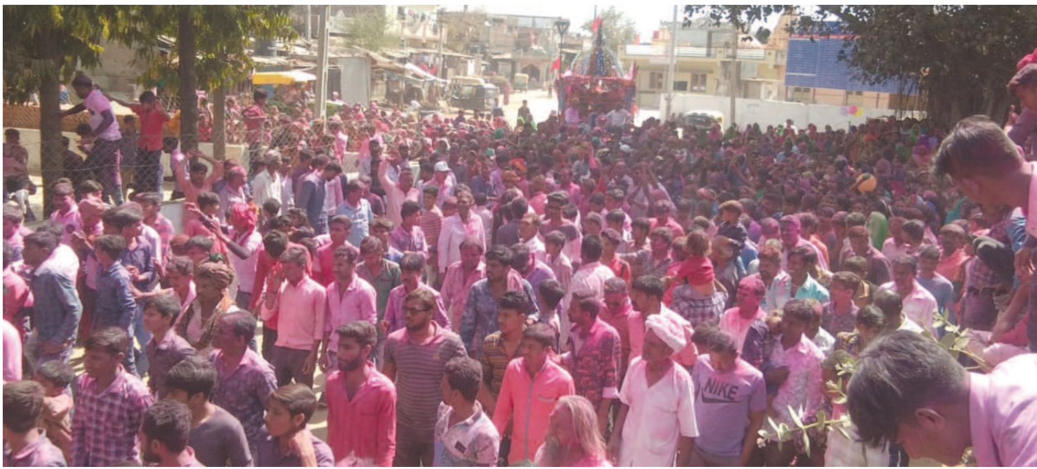
શોભાયાત્રા - ગાંધીનગર જિલ્લાના મગોડી ખાતે આવેલ સુપ્રસિદ્ધ મહાકાળી માતાજીના પ્રાણ પ્રતિષ્ઠા મહોત્સવ નિમિત્તે ધામધૂમપૂર્વક શોભાયાત્રાનું આયોજન કરવામાં આવ્યું હતું. શોભાયાત્રામાં મગોડી ગામના તથા આસપાસના વિસ્તારોના મહાકાળી માતાના ભક્તો, ગામના આગેવાનો સહિત મોટી સંખ્યામાં માનવ મહેરામણ જોડાયા હતા.