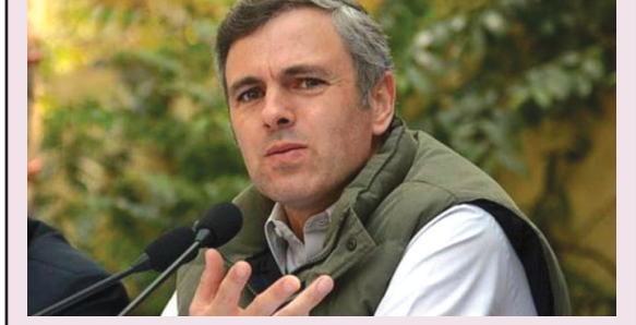
● અનુસંધાન પાન-૭ પર

ઉંમર અબદુલ્લાએ કેન્દ્ર સરકારને ચેતવણી આપી : કેન્દ્ર સરકાર જમ્મુ કાશ્મીરમાં ચૂંટણી પર જ ધ્યાન આપે