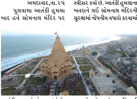
આંતકી હુમલાનું જોખમ વધ્યું છે. આવ્યો છે પરંતુ દરિયાઈ તાજેતરમાં મુખ્યમંત્રી રૂપાણીએ સક્રીય થઈ હોવાના ઈનપુટ મળ્યા

પરપ્રાંતીય બોટોના આંટાફેરા વધતા વેરાવળ માછીમાર બોટ એસોસિએશન દ્વારા તંત્રનું ધ્યાન દોરાયું : જવાબદારીને લઈ ઉદાસીનતા