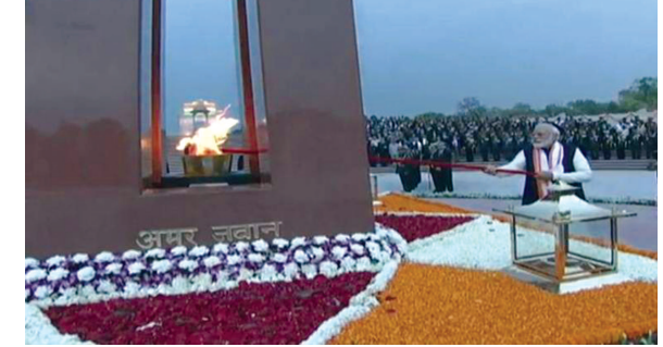
ન્યુ દિલ્હી, તા. ૨૫ દેશના વડાપ્રધાન નરેન્દ્ર મોદીએ સોમવારે દેશનું પ્રથમ રાષ્ટ્રીય યુદ્ધ સ્મારકનું લોકાર્પણ કર્યું છે. ભારત દેશ આઝાદ થયો ત્યારથી જ આ પ્રકારના સ્મારકની માંગ ઉભી થઈ રહી હતી. જોકે હવે દેશની આ ઈચ્છા આ વડાપ્રધાન નરેન્દ્ર મોદીની નેતૃત્વ વાળી સરકારના રાજમાં પૂર્ણ થઈ છે.

મોદી યાદ રહે કે ના રહે પણ સૈન્યની શૌર્યગાથા યાદ રહેવી જોઈએ : બોફોર્સ અને અન્ય કૌભાંડનો સંબંધ એક પરિવાર સાથે હતો જે ઘણું કહે છે : આપણા દેશની સેના દુનિયાની સૌથી શક્તિશાળી સેનાઓમાંની એક : સૈનિકો સાથે અન્યાય થયો : ૭૦ વર્ષથી મેમોરિયલની માંગ કરવામાં આવતી હતી : મોદી