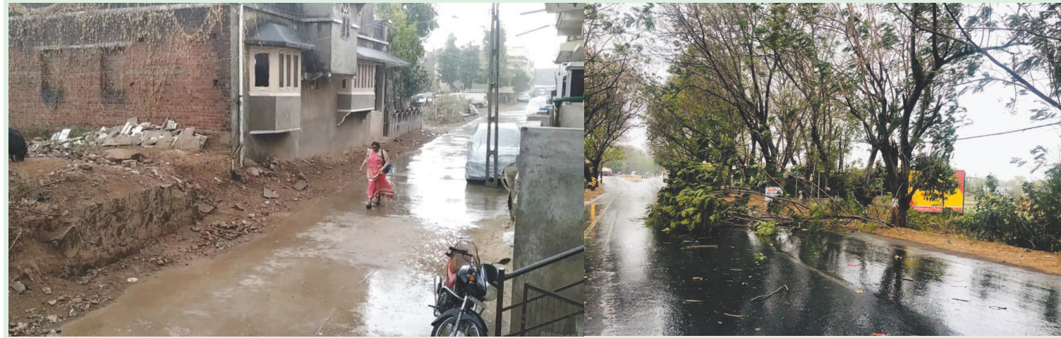
અરવલ્લી-સાબરકાંઠા જિલ્લામાં ભારે પવન સાથે કમોસમી વરસાદ : રાજેન્દ્રનગર ચોકડી પાસે ઝાડ ધરાશાયી

ખેડબ્રહ્મામાં મંગળવાર સાંજના અચાનક વાતાવરણમાં પલટો આવી વાવાઝોડું ફુંકાયું હતું અને રસ્તા પર ધૂળની ડમરીઓ ઉડવા લાગી હતી. થોડીવાર ફુંકાયેલ પવનથી વરસાદના છાંટા પડ્યા હતા. ખેડૂતોના જીવ તાળવે ચોટ્યા હતા.