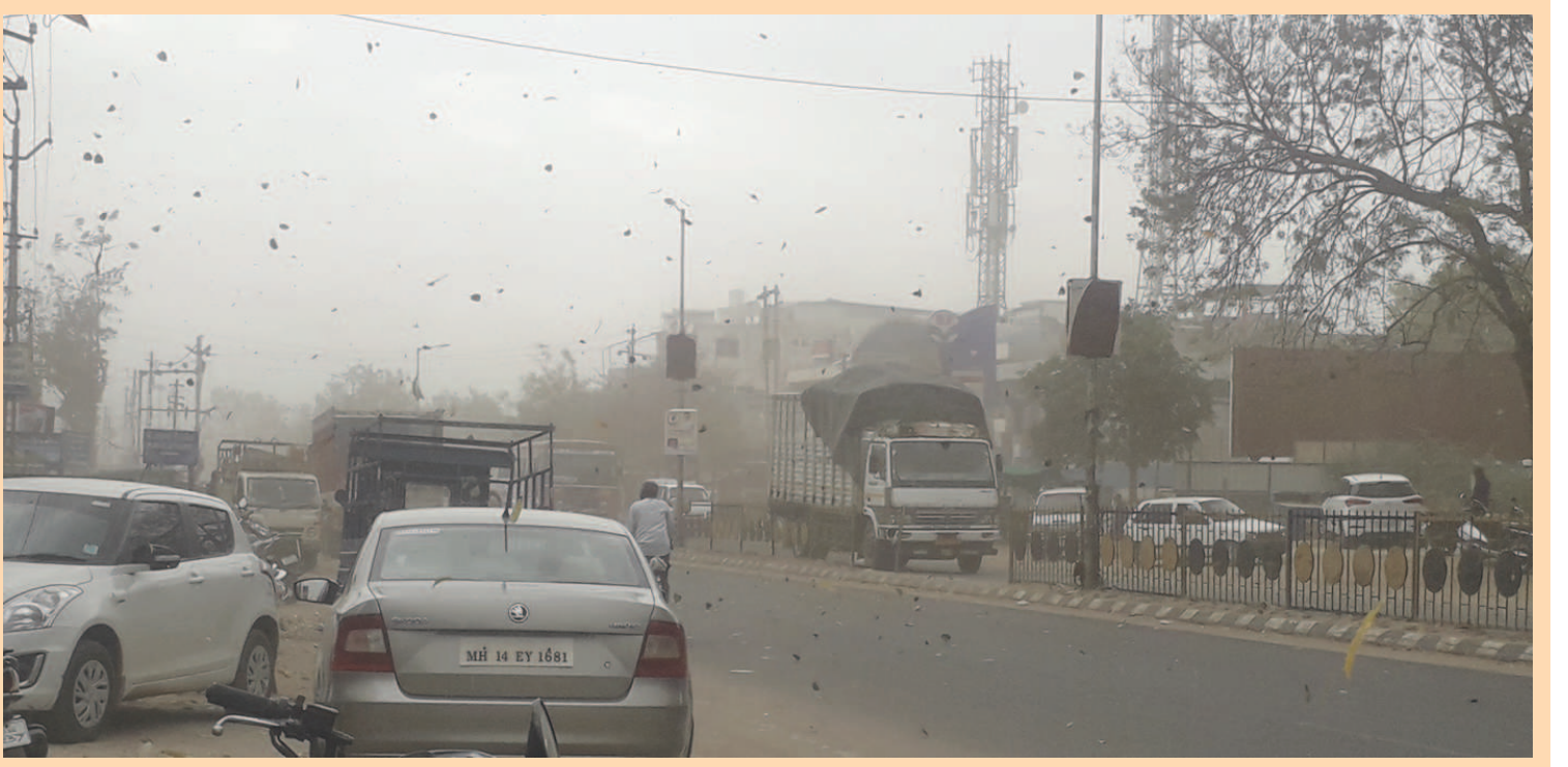
ખેડબ્રહ્મામાં વાતાવરણમાં પલટો, કમોસમી વરસાદ, છાંટા પડ્યા

કરતા નથી. દરમિયાન સોમવારે અને મંગળવારે વાતાવરણમાં આવેલા પલ્ટોને લોકોને હચમચાવી દીધા છે. દરમિયાન મંગળવારે સાંજના સુમારે વાતાવરણમાં આવેલા પલ્ટોને લઈને જોરદાર વાવાઝોડા અને ગાજવીજ ત્યારબાદ તરત જ જોરદાર પવન સાથે વરસાદના છાંટા શરૂ થઈ ગયા હતા અને તરત જ હિંમતનગરમાં અનેક ઠેકાણે કલાકો સુધી વીજપુરવઠો ખોરવાઈ ગયો હતો. વરસાદને લીધે હિંમતનગર તથા વિભાગના સૂત્રોમાંથી પ્રાથમિક માહિતીમાં જણાવવાયું છે. જિલ્લામાં પડેલા કમોસમી વરસાદને લીધે હિંમતનગરમાં અનેક ઠેકાણે મંડપો પવનના લીધે ફંગોળાઈ ગયા હતા જેના લીધે