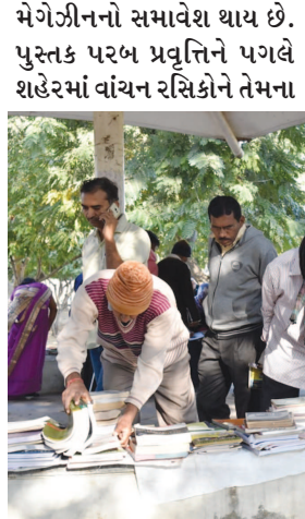
રસ અનુસારના વાંચન યોગ્ય પુસ્તકો વિના મૂલ્યે વાંચવા માટે અનેરી તક પ્રાપ્ત થઈ રહી છે જેના કારણે માનુભાષા સહિત અન્ય ભાષાના સાહિત્ય સર્જન સુધી પહોંચવાનો અવસર પણ પ્રાપ્ત થઈ રહ્યો છે. પુસ્તક પરબના નિયમિત અને સુચારુ

ગાંધીનગર, તા. ૨ ગાંધીનગરમાં આજે ફેબ્રુઆરી માસના પ્રથમ રવિવારે કુલગુલાબી ઈંડીમાં ૪-૪ સર્કલ નજીક સ્વહિમ પાર્ક ખાતે માનુભાષા અભિયાન અંતર્ગત આત્મન ફાઉન્ડેશન દ્વારા પુસ્તક પરબ યોજાઈ હતી. મૌસમની ઠંડક અને પવનના સુસવાટા વચ્ચે યોજાયેલી પુસ્તક પરબમાં સ્વહિમ પાર્કમાં જોડાઈ કરવા આવેલા મોનિંગ વોકર્સથી માંડીને શહેરના વાંચનપ્રેમી ભાવકોએ ઉમળકાભેર ભાગ લીધો હતો.