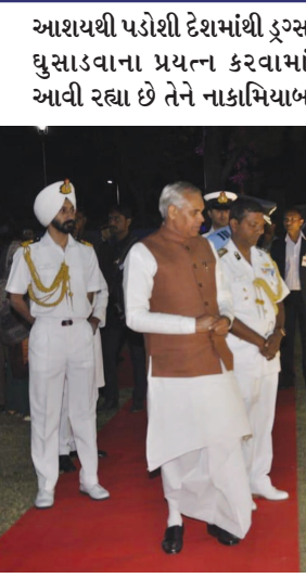
કરીને તટ રક્ષક દળ દ્વારા રાષ્ટ્ર સેવાની દિશામાં ખૂબ મોટું