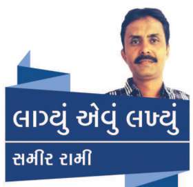
લાઠ્યું એવું લાખ્યું સમીર તમીર

સ્કીમ તૈયાર થાય ત્યારે વાસ્તવિક ચિત્ર કંઈક અલગ જ ખરું થાય તેવી સ્થિતિ સામાન્ય બનતી જાય છે. વળી, વારંવાર 'રિવાઈઝ પ્લાન'ના ઓથો તળે ક્યારે ગ્રાહક અકાદમીના ગુજરાત સાહિત્ય અકાદમીના ગુજરાત સાહિત્ય આગામી તા. ૪થી ફેબ્રુઆરી મંગળવારે સમર્પણ કોલેજ કેમ્પસ ખાતે 'સંસ્કૃત સાહિત્ય કૃતિઓના રસાસ્વાદ' વિષયક એક દિવસીય રાજ્ય સ્તરીય કાર્યક્રમનું આયોજન કરવામાં આવ્યું છે. જેમાં અધ્યક્ષાદે રાજ્યના પૂર્વ મુખ્યમંત્રી અને ગાંધીનગર ચેરિટીબલ ટ્રસ્ટના નિયમન અનુસરવામાં નહીં આવે તો આ સમસ્યા સમાજમાં માનસિક તણાવ વધારવાના કારણોમાં નોંધપાત્ર ફાળો પુરો પાડશે તેમાં લેશમાત્ર શંકા નથી. સંપૂર્ણ રેસિડેન્શિયલ હોય કે સંપૂર્ણ કોમર્શિયલ અથવા બંનેની સંયુક્ત સ્કીમ હોય પરંતુ પ્રોપર્ટી ડેવલપર્સને યોગ્ય અને અનુભવથી વંચીત પ્રોપર્ટી ડેવલપર્સને યોગ્ય અને વ્યાજબી ભાવે ફરજિયાત એલોટેમેન્ટ કરેલી પાર્કિંગ સ્પેસ આપવા સાથે મુલાકાતીઓ માટે પણ પુરતો પાર્કિંગ લોટ ફરજિયાત રાખવામાં આવે તે અત્યંત જરૂરી બનતું જાય છે. - પ્રતિભાવો આચકાર્ય : samirtalod@yahoo.com