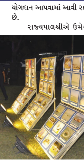
હતું કે, સમુદ્રમાં ઘણીવાર વિપરીત પરિસ્થિતિઓને કારણે