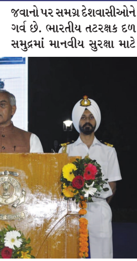
તૈનાત છે ત્યારે આપણા દેશની યુવાશક્તિને બરબાદ કરવાના