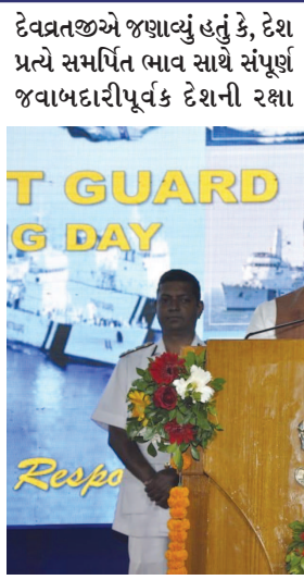
કરતા ભારતીય તટરક્ષક દળના જાંબાજ અધિકારીઓ અને

ગાંધીનગર, તા. ૨ ગાંધીનગર જીમખાના સેક્ટર-૧૯ ખાતે યોજાયેલી ૪૪માં તટ રક્ષક દિવસની ઉજવણીના અધ્યક્ષમમાં તટરક્ષક દળના અધિકારી - જવાનોને શુભેચ્છા આપતા રાજ્યપાલશ્રીએ જણાવ્યું હતું કે, ભારતીય તટરક્ષક દળ દરિયાઈ સુરક્ષા માટે સક્ષમ છે અને ગુજરાતના ૧૬૦૦ કિ.મી. દરિયા કિનારે આવેલા વિવિધ સ્ટેશનો પર સક્ષમતાથી રક્ષા કરી રહ્યું છે. ગુજરાતને સંવેદનશીલ બોર્ડરની જવાબદારી સવિશેષ મળી છે ત્યારે તેની સુરક્ષામાં આ દળની ભૂમિકા અત્યંત મહત્વપૂર્ણ છે. રાજ્યપાલશ્રી આચાર્ય