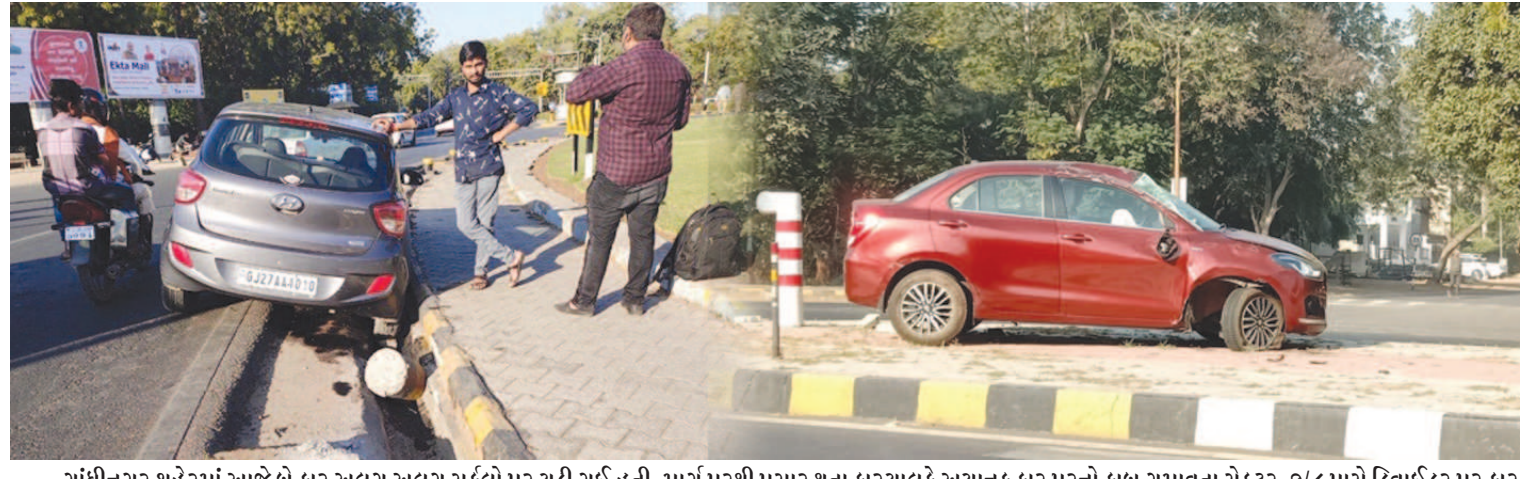
ગાંધીનગર શહેરમાં આજે બે કાર અલગ અલગ સર્કલો પર ચડી ગઈ હતી. માર્ગ પરથી પસાર થતા કારચાલકે અચાનક કાર પરનો કાબુ ગુમાવતા સેક્ટર-૭/૮ પાસે ડિવાઈડર પર કાર ચડી ગઈ હતી. તો બીજા બનાવમાં બપોરના સમયે શહેરના મુખ્ય ઘ-૩ સર્કલમાં કાર માર્ગ પરથી નીચે ઉતરતા કાર નમી ગઈ હતી.