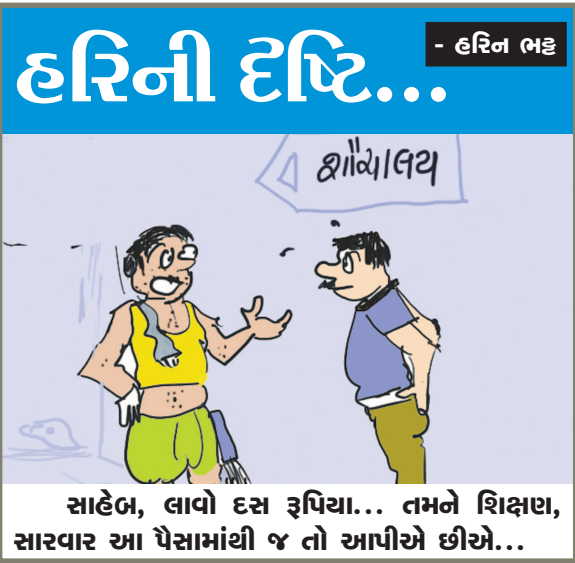
સાહેબ, લાવો દસ રૂપિયા... તમને શિક્ષણ, સારવાર આ પૈસામાંથી જ તો આપીએ છીએ...