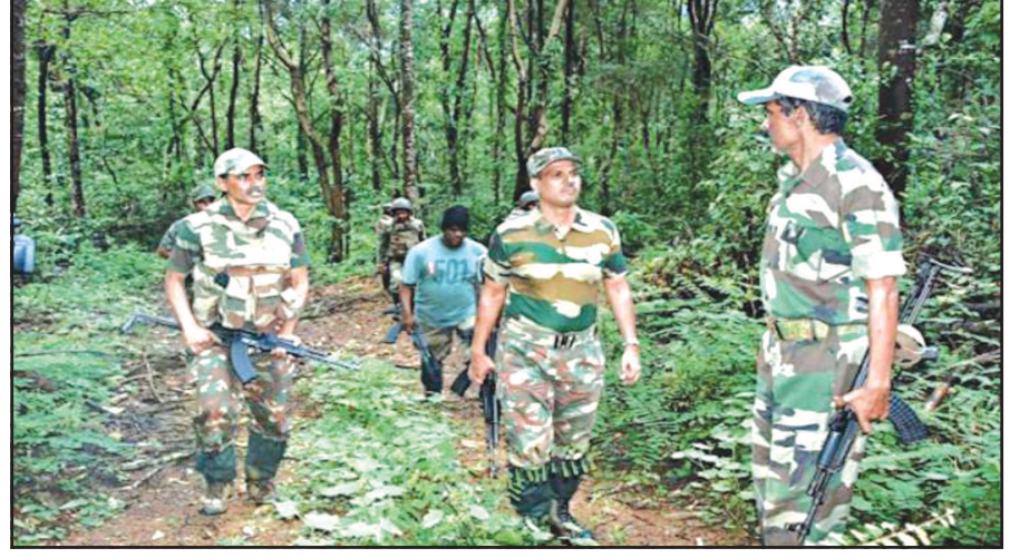
સુકામાં રવિવાર સાંજે મળી આવ્યા હતા. જેને જંગલના જવાનો પસાર થાય છે.

જેવા મામલાઓમાં શોધખોળ સર્ચિંગ પર નીકળેલા એ રસ્તા પર જમીન પર સંતાડીને ચાલી રહી છે. સીઆરપીએફ જવાનોને આઈડી