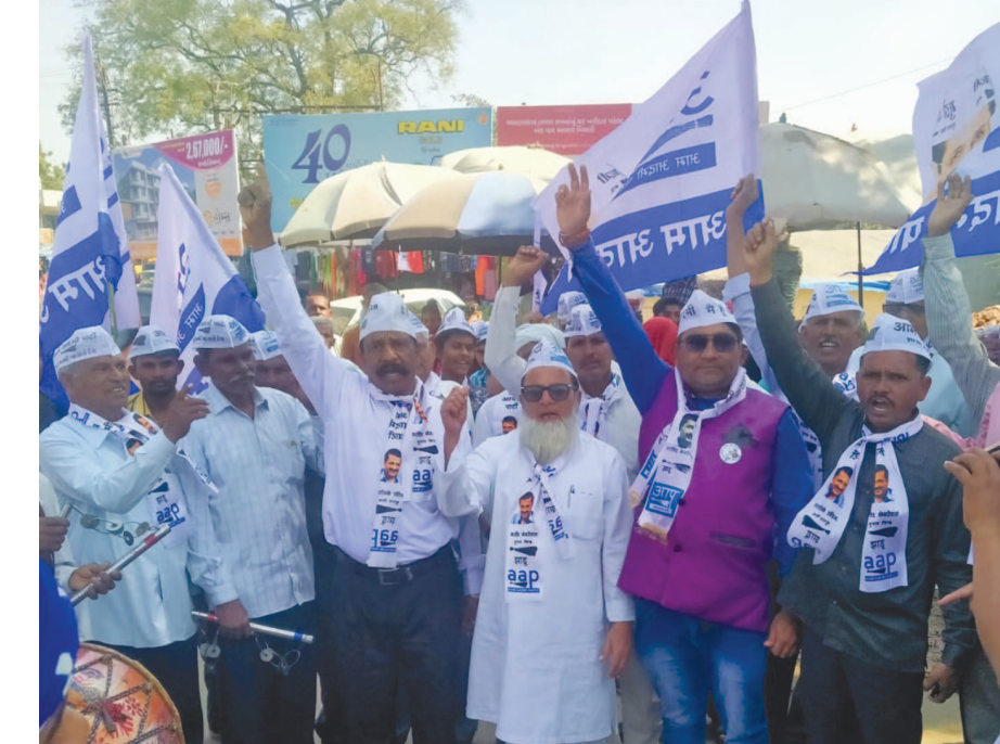
મિલોડામાં આમ આદમી પાર્ટીના વિજયને વધાવાયો