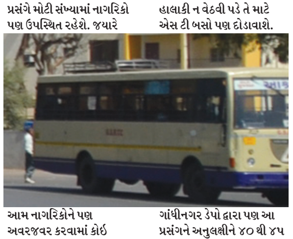
આમ નાગરિકોને પણ અવજરવર કરવામાં કોઈ

ગાંધીનગર તા. ૧૪ વિશ્વના સૌથી મોટા સ્ટેડિયમનું પ્રધાનમંત્રીના હસ્તે ઉદ્ઘાટન કરવામાં આવનાર છે. જ્યારે આ સમારોહમાં મુખ્યમહેમાન પદે અમેરિકાના પ્રમુખ પણ વિશેષ ઉપસ્થિત રહેશે. જ્યારે આ વિશિષ્ટ કાર્યક્રમને અનુલક્ષી આમ નાગરિકો પણ સ્થળ પર હાજરી આપી શકે તે માટે એસ ટી ૩ પો દ્વારા જિલ્લાના વિવિધ રૂપોની અંદાજિત ૪૦ થી ૪૫ બસો ફાળવવામાં આવશે. જ્યારે આ સ્થિતિ વચ્ચે એસ ટી