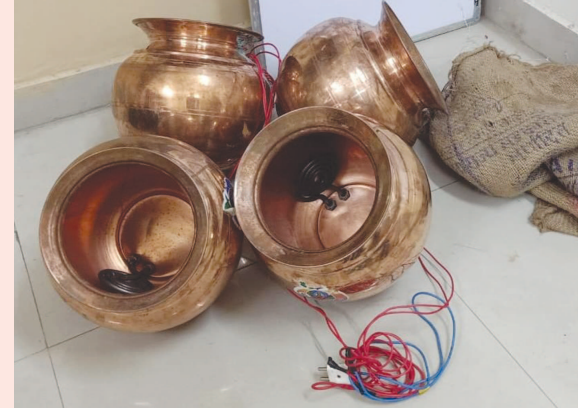
કંતાના કોથળાના પાર્સલ પડી ગયા હતા. રેલવે પોલીસે તપાસ કરતા તેમાંથી સંદિગ્ધ હાલતમાં પોલીસે તાંબાના કળશ કબ્જે લઈને વધુ તપાસ હાથ ધરી છે.

પાલનપુર તાલુકાના ચિત્રાસણી ગામ પાસેથી હિટર યુક્ત તાંબાના કળશ મળી આવતા રૂ.૩૬૦૦ ની કિંમતના મુદ્દામાલ ને જામ કરવામાં આવ્યો છે.