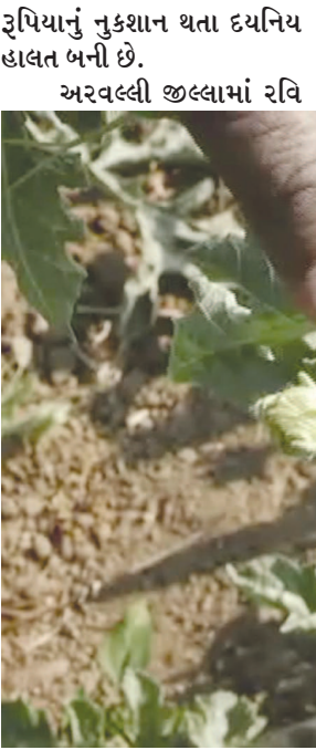
સીજનમાં જિલ્લાના ખેડૂતોએ જિલ્લાની અંદાજે પ હજાર હજાર હેક્ટર જમીનમાં ખેડૂતોએ તરબૂચનું વાવેતર કર્યું છે.

મોડાસા, તા. ૧૭ અરવલ્લી-સાબરકાંઠા જિલ્લામાં ખેતીવાડી વિભાગની આંખ નીચે નકલી બિયારણ અને ડુપ્લીકેટ જંતુનાશક દવાઓનો વેપલો પુલ્વેઆમ ચાલી રહ્યો છે. બંને જિલ્લામાં ખેતીવાડી વિભાગના કેટલાક અધિકારીઓ અને કર્મચારીઓની સિલીભગતના પગલે નકલી બિયારણનું વેચાણ કરતા વિકેતાઓ બિલાડીના ટોપની જેમ કુલ્યાકાલ્યા હોવાનું ખેડૂતો અહેસાસ અનુભવી રહ્યા છે. નકલી બિયારણનો ભોગ બનનાર ખેડૂત વાવેતર કર્યા પછી દિવસરાત કાળી મજૂરી કર્યા પછી લગભગ સમયે પાકનો ફાલ ન ઉતરતા પોક મૂકીને રોવાનો વારો આવતો હોય છે. મોડાસા તાલુકાના ગલસુંદરા ગામના ખેડૂતને ઈડરના બિયારણના વિકેતાએ નકલી તરબૂચનું બિયારણ પધરાવતા ૮૦ દિવસની મહેનત પાણીમાં જતા બાબ્બો