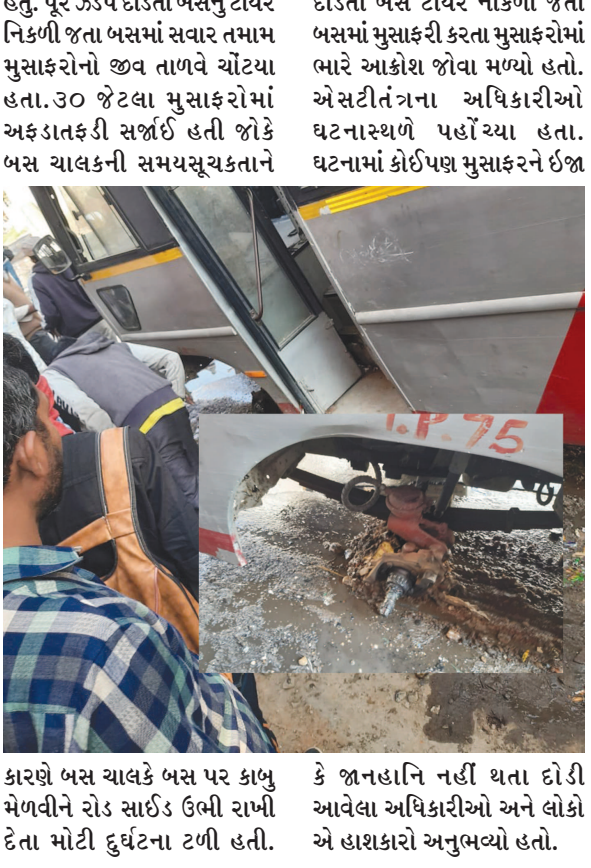
કારણે બસ ચાલકે બસ પર કાબુ મેળવીને રોડ સાઈડ ઉભી રાખી દેતા મોટી દુર્ઘટના ટળી હતી. કે જાનહાનિ નહીં થતા દોડી આવેલા અધિકારીઓ અને લોકો એ હાથકારો અનુભવ્યો હતો.

ગુજરાત રાજ્ય પરિવહન નિગમની અડધો-અડધ બસો યોગ્ય સમારકામના અભાવે ખખડપણ ઢાલતમાં ઉપયોગમાં લેવાતી હોવાનું મુસાફરો અનેકવાર ફરિયાદ કરી ચુક્યા છે અને અનેકવાર રસ્તામાં પોટકાથી પડવાની અને અકસ્માતની ઘટનાઓ ઇસવારે બનતી હોય છે. “બસની મુસાફરી સલામતીની સવારી”ના બદલે લોકો જીવવા જોખમ પ્રવાસ ખેડાતા હોય તેવો અહેસાસ અનુભવી રહ્યા છે. અરવલ્લી જિલ્લામાં બસોની ખખડપણ ઢાલતની પોલ ખોલતી વધુ એક ઘટના પ્રકાશમાં આવી છે. મોડાસાના સાયરા નજીક રોડ પર દોડતી એસટી બસનું ટાયર નિકળી જતા બસમાં સવાર ૩૦ જેટલા મુસાફરોના જીવ તાળવે ચોંટી ગયા હતા.