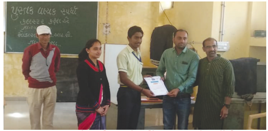
“પુસ્તક વાચક સ્પર્ધા”માં મોડાસાની સર્વોદય સ્કૂલના વિદ્યાર્થીઓ પ્રથમ

ઉગ્ર તાલુકાના ડુંડાવ ગામના નાના બાર કડવા પાટીદાર સમાજ (નાળોદ)ના પરિવારો દ્વારા બેસણું અને બારમા પાછળ બતા ભોજનને બંધ કરવાનો નિર્ણય કરવામાં આવ્યો. વ્યક્તિના મૃત્યુ પ્રસંગે ભોજન પાછળના ખર્ચ અને નાણાંનો દુર્વ્યય અટકાવી સાચા અર્થમાં પુણ્ય કમાવવા સામાજિક પહેલ કરાઈ છે. ડુંડાવ ખાતે નાના બાર કડવા પાટીદાર સમાજની સોમવારે મળેલી સાધારણ સભામાં કરાયેલ ઉદઘોષ મુજબ ગામના કોઈપણ વ્યક્તિના અવસાન પાછળ કરવામાં આવતા જમણવારમાં ભોજન નહીં લેવાનો નિર્ણય કરવામાં આવ્યો છે. અંત્યેષ્ટી ભોજન પાછળ પરંપરાના નામે કરજીયાતપણે કરવામાં આવતા બિનજરૂરી ખર્ચને અટકાવવા આ આવકદારાયક નિર્ણય લેવામાં આવ્યો છે. ઉલ્લેખનીય છે કે, આ અગાઉ ડુંડાવ ગામના મોટા ભાગના સમાજ (નાળોદ)ના પરિવારોએ બેસણું અને બારમા પાછળ બતા ભોજન બંધ કરવા નિર્ણય કર્યો હતો. જેને નાના બાર સમાજના પરિવારોએ પણ અપનાવી સામાજિક પરિવર્તનના મહાયજ્ઞમાં પોતાનું યોગદાન આપ્યું છે. બદલાતા સમય સાથે કરવામાં આવતા આ સામાજિક પરિવર્તનની પહેલમાં સમય જતાં સૌ સમાજના લોકો જોડાશે તેમ જણાઈ રહ્યું છે.