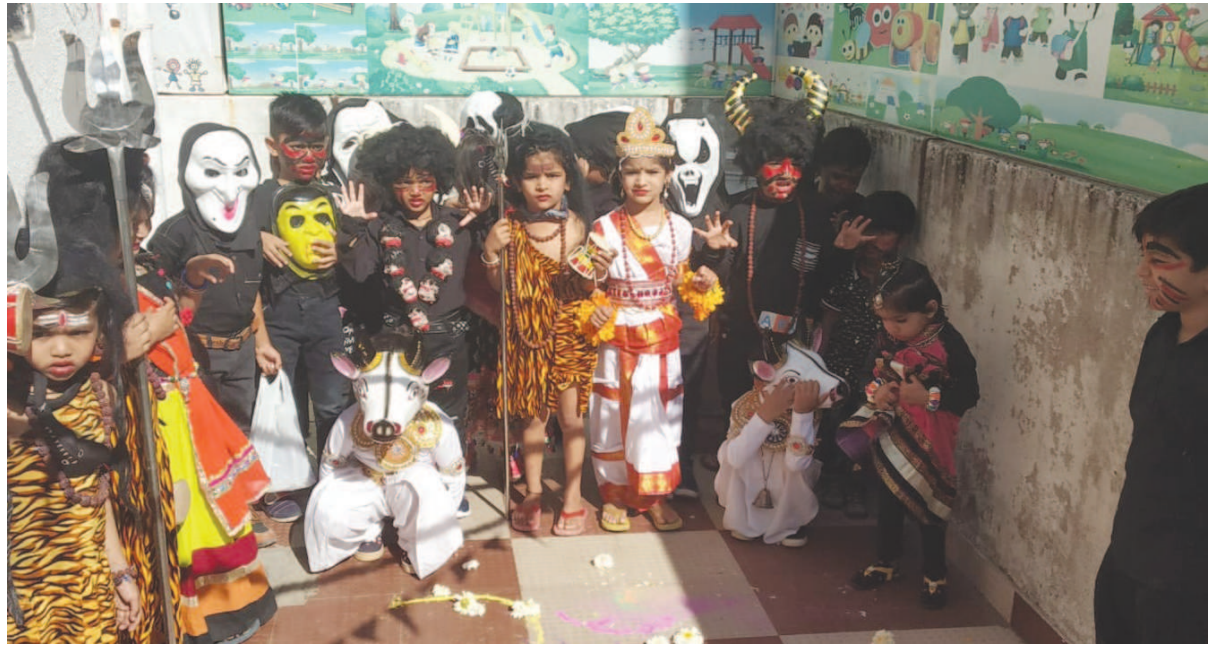
શક્તિપીઠ અંબાજી ખાતે આવેલ કિડ્સ ગાર્ડન જુનિયર ચિલ્ડ્રન સ્કૂલ ખાતે શિવરાત્રી ઉજવાઈ