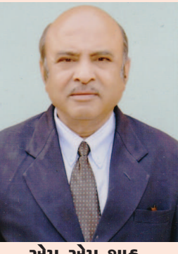
એમ એમ શાહ