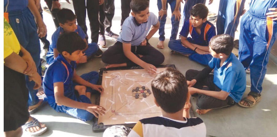
મહર્ષિ અન્નિ તપોવન, પીપળજ ખાતે રમતોત્સવનું આયોજન કરવામાં આવ્યું હતું, જેમાં મહર્ષિ અન્નિ માધ્યમિક શાળા, પીપળજ, તક્ષશિલા વિદ્યાલય-મહેસાણા, નાલંદા વિદ્યાલય-પ્રાંતિજ, નચિકેત વિદ્યાલય-હિંમતનગર વગેરે શાળાનાં બાળકોએ ઉત્સાહ પૂર્વક ભાગ લઈ રમતો માણી હતી. બાળકો ઈનામ કે વિજેતા કમની અપેક્ષા વગર રમતો રમ્યા હતા એ આ ઉપક્રમની વિશેષતા હતી.