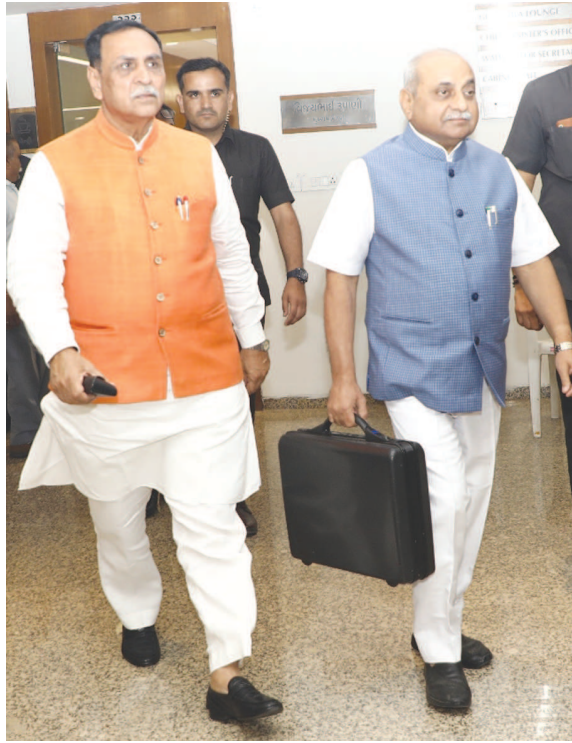
જાહેરાત કરી છે. બજેટમાં રાજ્ય સરકારે યાત્રાધામો અને પ્રવાસનોને વિકસાવવા માટે પણ અનેક આયોજન કર્યા છે. જેમાં કૃષ્ણનગરી દ્વારકાનો વિકાસ આયોજન કરવામાં આવ્યું છે.

ટકા કરવાની તેમજ વેપારી અને વાણિજ્યિક વર્ગ પરનો વીજકર ૨૫ ટકાથી ઘટાડીને ૨૦ ટકા કરવાની દરખાસ્ત મૂકી છે. નીતિન પટેલે રાજ્યના બજેટમાં ૨૭૫