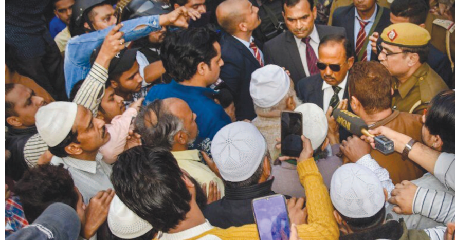
દોભાલે બાજી સંભાળી લીધી છે. દોભાલે ગઈકાલે રાતે પણ વિવિધ વિસ્તારોમાં પહોંચી જઈને પરિસ્થિતિની સમીક્ષા કરી હતી. રાષ્ટ્રીય પાટનગર દિલ્હીમાં જારી હિંસાના દોર વચ્ચે હવે કેન્દ્રીય ગૃહ પ્રધાન અમિત શાહ અને રાષ્ટ્રીય સુરક્ષા સલાહકાર અજિત દોભાલ જોરદાર રીતે સક્રિય થયેલા છે. બંને

નવી દિલ્હી, તા. ૨૬ રાષ્ટ્રીય પાટનગર દિલ્હીમાં વ્યાપક હિંસામાં ૨૩ લોકોના મોત અને હથિયારો સાથે હિંસા પર ઉતારવાના બનાવો, મુતદેહ મળી આવવાના સિલસિલા વચ્ચે આજે રાષ્ટ્રીય સુરક્ષા સલાહકાર અજિત દોભાલે બેઠકોનો દોર જારી રાખ્યો હતો. અનેક હિંસાગ્રસ્ત વિસ્તારમાં પરિસ્થિતિની સમીક્ષામાં અજિત દોભાલ પહોંચ્યા હતા. અધિકારીઓ સાથે સતત બેઠકો યોજાઈ હતી. પરિસ્થિતિની સમીક્ષા કરવા અજિત દોભાલ સિલમપુર અને અન્ય હિંસાગ્રસ્ત વિસ્તારમાં પહોંચ્યા હતા. હિંસા વચ્ચે કેન્દ્રીય ગૃહમંત્રી અમિત શાહ અને રાષ્ટ્રીય સુરક્ષા સલાહકાર અજિત