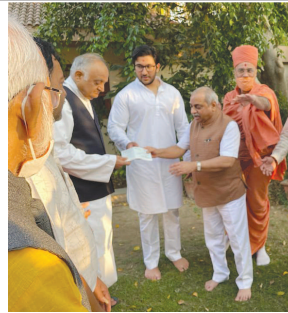
શ્રી સ્વામીનારાયણ મંદિર કાલુપુર, નરનારાયણ દેવ ટ્રસ્ટ દ્વારા પૂ. મોટા મહારાજ તેજેન્દ્ર પ્રસાદજી, આચાર્ય મહારાજ કોશલેન્દ્ર પ્રસાદજી તથા લાલજી મહારાજના વરદહસ્તે રામ મંદિરના નિર્માણ માટે રૂ. ૧ કરોડની રકમના દાનનો ચેક નાયબ મુખ્યમંત્રી નીતિનાભાઈ પટેલ તથા વિશ્વ હિન્દુ પરિષદના અગ્રણીઓને અર્પણ કરાયો હતો.

ગાંધીનગર, તા. ૫ ગાંધીનગર નજીક કોલવડા રેલ્વે ક્વાર્ટર પાસેથી પેશન પ્રો બાઈકની ચોરી થવા પામી છે. ચૈનારામ રૂઢાચામ જાટ (ચૌધરી) એ પેથાપુર પોલીસ મથક નોંધાવેલી ફરીયાદ મુજબ તેઓ છોલ્લા એક માસથી રેલ્વેનો કોન્ટ્રાક્ટ કોલવડા ખાતે ચાલતો હોવાથી રેલ્વે ક્વાર્ટર ખાતે રહે છે. જ્યારે ફરીયાદી તેના મોટાભાઈનું પેશન પ્રો બાઈક નં. જી.જે. ૨૭.એ.એફ.-૩૧૧૭૫ આવન જાવન માટે ઉપયોગ કરતા હતા. ગત તા. ૨ ના રોજ બાઈક દિવસ દરમિયાન ઉપયોગ કરીને રાત્રીના ૮ લાગવાના અરસામાં બાઈક પાર્ક કર્યું હતું અને ક્વાર્ટરમાં સુઈ ગયા હતા. જ્યારે તા. ૩ ને સવારે ઉઠીને જોયું તો પાર્ક કરેલી જગ્યાએ બાઈક ન હતું. જેથી આસપાસના ભાવિકોમાં શોષપોળ કરી છતા મળી આવ્યું ન હતું. જેથી આખરે પેથાપુર પોલીસ મથક ૩.૮ હજારના બાઈક ચોરી અંગે ગુનો નોંધી આગળની તપાસ હાથ ધરી છે.