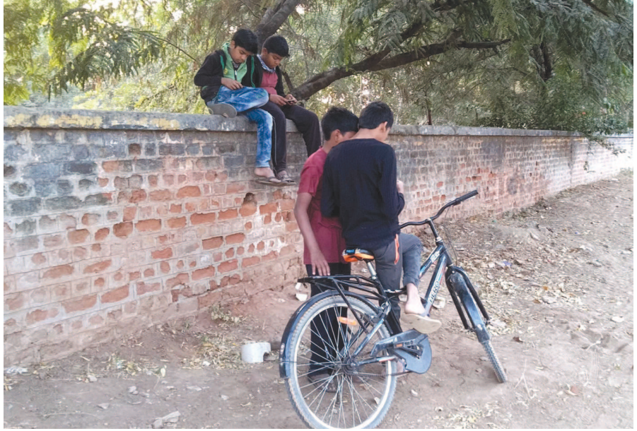
શાળાઓ છોલ્લા ઘણા સમયથી બંધ છે. ઓનલાઈન અભ્યાસ કરીને બાળકો જાણે થાય છે. બાળકો માટે સમય હવે ક્યાં પસાર કરવો તે મોટો પ્રશ્ન બની ગયો છે. સેક્ટર-૬ પ્રાથમિક શાળાની દિવાલ બેસીને મોબાઈલમાં વ્યસ્ત રહી આ નાના બાળકો સમય પસાર કરી રહ્યા છે.