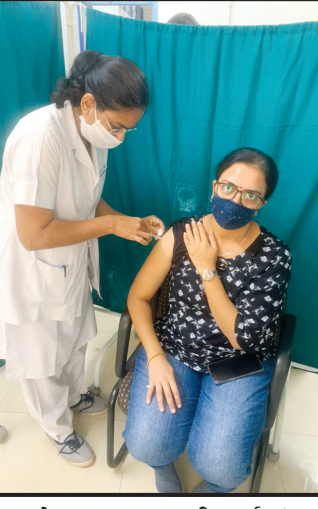
આજના વેક્સીનેશન દરમિયાન કોઈને પણ આડ અસર થયાનું જણાયું નથી.

ગાંધીનગર, તા. ૫ ગાંધીનગર જિલ્લામાં આજે ૧૬૦૦થી વધુ કોરોના વોરિયર્સનું વેક્સીનેશન કરવામાં આવ્યું હતું. જિલ્લાના ગ્રામ્ય વિસ્તારમાં ૧૩૩૩ વોરિયર્સનું તથા શહેરમાં ૩૧૨ વોરિયર્સનું વેક્સીનેશન કરવામાં આવ્યું હતું. આજે એક પણ વોરિયર્સને વેક્સીનેશન દરમિયાન આડ અસર થઈ હોવાનું જણાયું નહિ હોવાનું તંત્રએ જણાવ્યું છે. જિલ્લાના ગ્રામ્ય વિસ્તારમાં આજે ૧૩ સેશન સાઈટ પર વેક્સીનેશનની કામગીરી હાથ ધરવામાં આવી હતી.