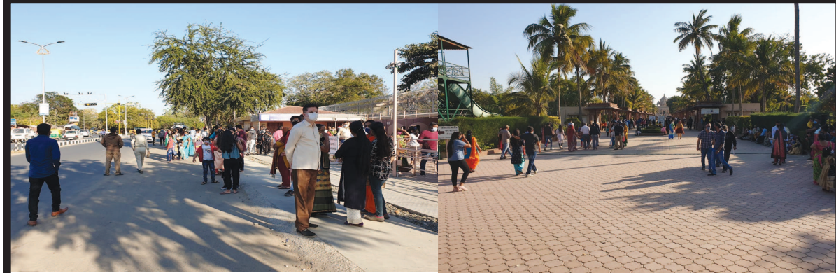
શહેર કોરોનાનો ડર ઓછો થવાને કારણે ફરી ધમધમતું થયું છે ત્યારે શહેરના મંદિરોમાં પણ ભક્તોની ભીડ જામી છે. શહેરના સે-૨૦ સ્થિત અક્ષરધામ મંદિરમાં રવિવારની રજાના દિવસે ભક્તોની ભીડ જણાઈ હતી.

વધુ મોટો છે પરંતુ જે નાગરિકો ફરિયાદ નોંધાવે છે તેમને તેમના નાણાં પરત મળવામાં પણ હજુ આપણી સાયબર સિક્યુરિટી ખૂબ પાછળ છે. અત્યારે કિશિંગ ઈમેલ જેમાં તમને કોરોડોની લોટરી કે ઈનામ લાગ્યું છે, કોઈએ તમને રાતોરાત વારસદાર બનાવી દીધા છે, તમને મોંઘો ઈમ્પોર્ટ ફોન કે લેપટોપ સાવ સસ્તામાં ઓફર કરાયો છે, તમારો નંબર ફલાણી જાણીતી