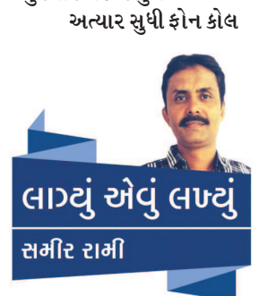
લાઠવું એવું લાઠવું સમીર રામી

આમઘાત સુધી દોરી જાય તેટલી કફોડી બની રહી છે. વળી, સાયબર સિક્યુરિટીના નામે હજુ સુધી ફીક્ષન પાડવું પોલીસ તંત્ર પણ આ ગુનાખોરી ડામવામાં વામણું પુરવાર થઈ રહ્યું છે. અત્યાર સુધી ફોન કોલ