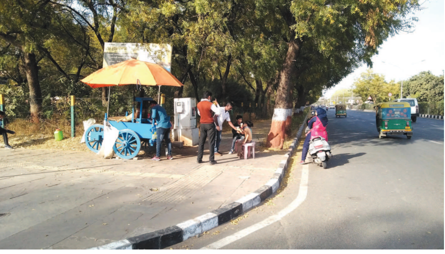
ઉનાળાનું આગમન બિલ્લી પગે થઈ રહ્યું છે. સાંજના સમયે થોડીક ઠંડક અનુભવાય છે. પરંતુ દિવસ દરમિયાન તો હવે ચોકકસ થોડીક ગરમી લાગવા માંડી છે. ઉનાળો હજુ પુણ્ય બેઠો નથી ત્યાં તો શહેરમાં ટેર ટેર શેરડાના કોલા જોવા મળી રહ્યાં છે. શેરડીના કોલા પર ઘરાકી પણ જોવા મળી રહી છે. ઘરાકી ધીમે ધીમે જામતી જાય છે.