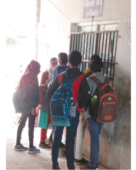
માટે કન્સેશનથી પાસ કાઢી આપવામાં આવે છે. હવે કોરોનાનું સંક્રમણ ઘટ્યું છે એટલે નિયમિત સ્કુલો ચાલુ રહેશે તેવું જણાતાં વિદ્યાર્થીઓ પાસ માટે બસ મથકોએ કતારમાં આવી રહ્યા છે. પરંતુ વિદ્યાર્થીઓના વિશાળ આરોગ્ય હીતને ધ્યાને રાખી વિભાગે એસ.ટી. પાસ માટે પાસ વ્યવસ્થા ગોઠવવી જોઈએ.

બાયડ (બુરો ઓફિસ) તા. ૧૦ જિલ્લાના શૈક્ષણિક સંકુલોમાં ધો.૮ થી ૧૨ના વિદ્યાર્થીઓ માટે શિક્ષણ કાર્ય શરૂ થયું છે. ગત સોમવારથી કોલેજો શરૂ થઈ ત્યારે શૈક્ષણિક સંકુલો વિદ્યાર્થીઓના કલરવથી ગુંજવાની સાથે બસ મથકો ઉપર એસ.ટી. પાસ મેળવવા વિદ્યાર્થીઓનો ધસારો જોવા મળ્યો છે. કોરોનાનું સંક્રમણ છે આ સંજોગોમાં વિદ્યાર્થીઓનું આરોગ્ય ન જોખમાય તે માટે એસ.ટી. વિભાગ દ્વારા જે તે શૈક્ષણિક સંકુલમાં એસ.ટી. પાસ વિદ્યાર્થીઓ મેળવી શકે તે પ્રકારની વૈકલ્પિક વ્યવસ્થા ગોઠવવાની અનેક વાલીઓએ માંગ કરી છે. પાસ કઢાવવા સમયે જિલ્લામાં ઈન્ટરનેટના પાંધિયા અને ધીમી સ્પીડના કારણે વિદ્યાર્થીઓને લાંબા સમય ઉભા રહેવાની ફરજ પડે છે. સરકાર દ્વારા વિદ્યાર્થીઓને રાહત દરના વિદ્યાર્થી પાસની સુવિધા આપવામાં આવે છે. જેમાં શાળા-કોલેજના વિદ્યાર્થીઓને ફોર્મ ઉપર આચાર્યના સહીસિક્કા કરી આપ્યા પછી એસ.ટી. વિભાગ દ્વારા પાસનો લાભ આપવામાં આવતો હોય છે. સાબરકાંઠા, અરવલ્લી જિલ્લાના તમામ શૈક્ષણિક સંકુલોમાં ધો. ૮ થી ૧૨ના વર્ગો અને તમામ કોલેજોમાં શિક્ષણ કાર્ય શરૂ થતાં એસ.ટી. બસમાં પ્રથમ વખત કોરોના પછી હાઉસ્કુલ મુસાફરો જોવા મળે છે. વિદ્યાર્થીઓને અભ્યાસ