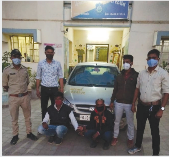
અંદરના ભાગે જોતા વિદેશી બોટલ નંગ - ૨૭ મળી આવતાં દારૂની અલગ અલગ બ્રાન્ડની રાજસ્થાનના બંને શખ્સોની

હિંમતનગર (બુરો ઓફિસ) તા. ૧૦ હિંમતનગર ગ્રામ્ય પોલીસે પેટ્રોલિંગ દરમિયાન મળેલી બાતમીના આધારે હિંમતનગર - વિજાપુર હાઈવે પરના દેરોલ ચેકપોસ્ટ પાસે પેટ્રોલિંગ દરમિયાન પોલીસને બાતમી મળી હતી કે, રાજસ્થાન તરફથી એક હુંડાઈ ગાડી જી.જે.૦૧.એચ.કયુ.૬૦૭૧ વિજાપુર રોડ થઈને ગાંધીનગર તરફ જવાના છે અને તેના આગળના ભાગમાં ગુમ ખાવાનું બનાવી વિદેશી દારૂની બોટલ સંતાડેલ છે જે બાતમીના આધારે હિંમતનગર ગ્રામ્ય પોલીસે વોચ ગોઠવી બાતમી મુજબ ની કાર આવતા કોર્ડન કરી તેની પકડ લીધી હતી જેની તપાસ હાથ ધરતા ગાડીના આગળના ભાગના ખાનામાં તથા મ્યુઝિક ટેપ ના