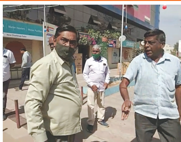
સ્થાનિક સ્વરાજ્યની ચૂંટણીઓમાં પાટીદારોની નારાજગી સહન કરવી પડશે ની ચીમકી ઉચ્ચારી ભાજપ પાટીદારોને અન્યાય કરતો હોવાનું જણાવ્યું હતું

હતો ભાજપ મોવલિ મંડળ અને સ્થાનિક સંગઠન જિલ્લા પંચાયતની ૩૦ બેઠકોમાંથી ૨૬ બેઠકો પર ઉમેદવારોના નામ જાહેર કર્યા હતા ૪ બેઠક પર ઉમેદવારોની પસંદગી માટે થોભો અને રાહ જોવાની નિતી અપનાવી છે ભાજપને જિલ્લા પંચાયત બેઠકોના ઉમેદવારોની જાહેરાત કરતાની સાથે ભાજપમાં ભડકો થયો હોય તેવી સ્થિતિ કઈ સીટ પર સર્જાઈ હતી કઈ સામાન્ય સીટ પર ઉમેદવારોની માટે દાવેદારી નોંધવાનાર પાટીદાર સમાજના ભાજપ પક્ષ સાથે સંકળાયેલ અગ્રણીઓ ભાજપ સામાન્ય સીટ પર ઓબીસી ઉમેદવારને ઉતારતાની સાથે ભડકો થયો હતો અને ભાજપ કાર્યાલય ખાતે