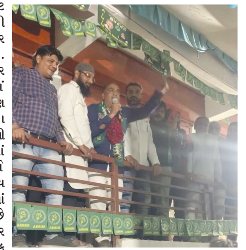
કોંગ્રેસની ભૂમિકામાં આવી જાય તો નવાઈ નહિ...!! મોડાસા નગરપાલિકાની ચૂંટણીમાં આમ આદમી પાર્ટી અને AIMIMની એન્ટી ભાજપ કોંગ્રેસનું સત્તા ધંધલ કરવાનું ગણીત પર ભારે પડી શકે છે. ઓવેસીની પાર્ટીના આગમનથી કોંગ્રેસને નગરપાલિકામાં મોટો ફટકો પડી શકે છે નું રાજકીય વિશ્લેષકો માની રહ્યા છે.

મોડાસા શહેરમાં લઘુમતી સમાજમાં જાણે AIMIM માં જોડાવા છોડે લાગી હોય તેમ બુધવારે રાત્રે કાર્યાલય પર પાર્ટીના સભ્ય બનવા માટે રીતસર પડાપડી કરી હતી. મોડાસા નગરપાલિકાની ચૂંટણીમાં AIMIM પાર્ટી